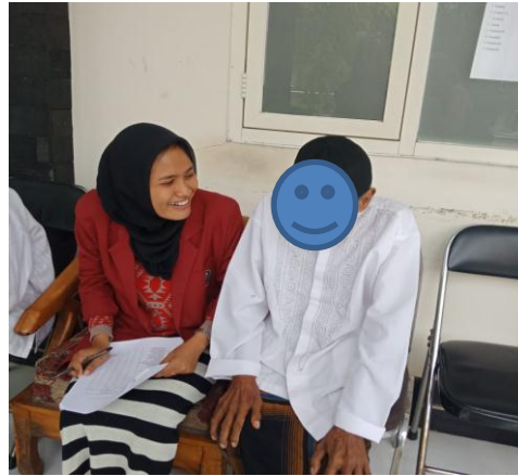
Gambar.1 Pengisian Kuesioner dan wawancara dengan kedua responden