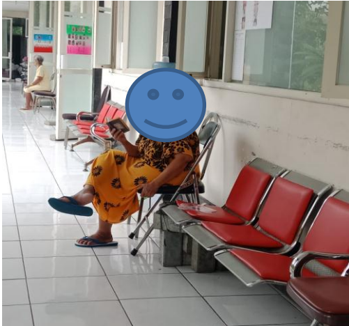
Gambar.4 Aktivitas Spiritual di UPTD Griya Werdha Surabaya