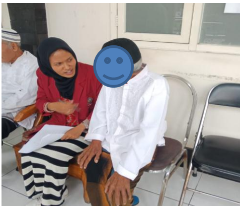
Gambar.2 Penelitian hari kedua di UPTD Griya Wedha Surabaya