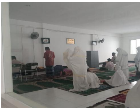
Gambar.3 Aktivitas Spiritual yang di lakukan di UPTD Griya Werdha Surabaya