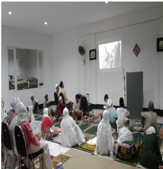
Gambar.5 Aktivitas Spiritual di UPTD Griya Werdha Surabaya