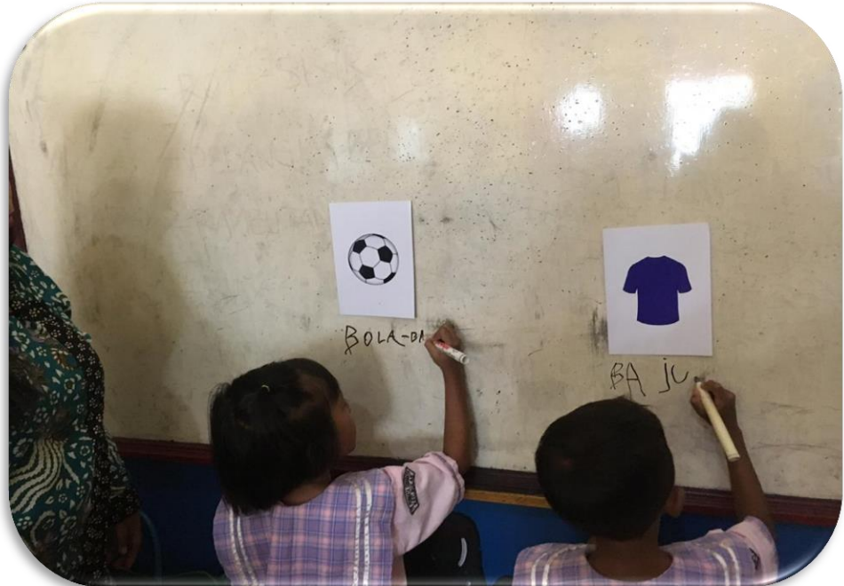
Gambar 10. Anak membuat kata menjadi kalimat