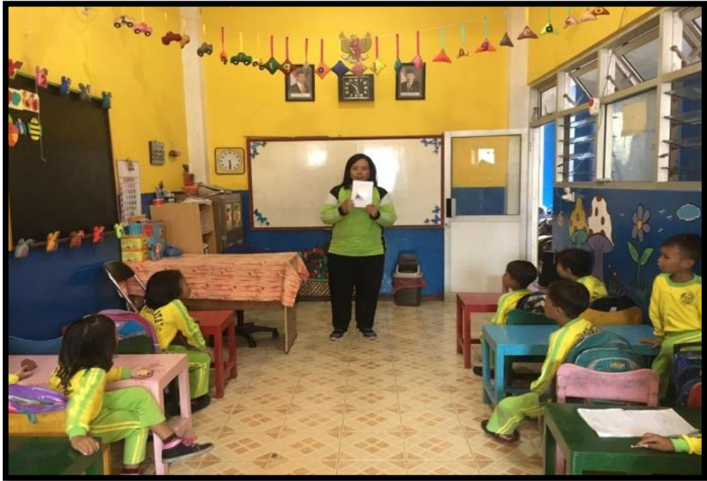
Gambar 1. Guru menerangkan kartu gambar