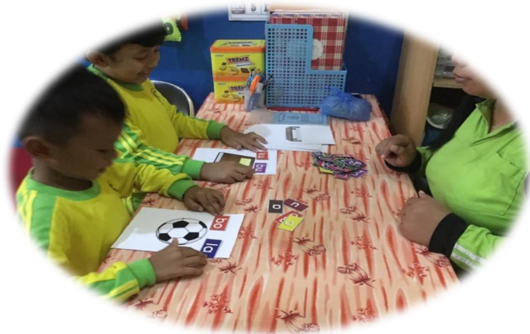
Gambar 3. Anak menggabungkan huruf