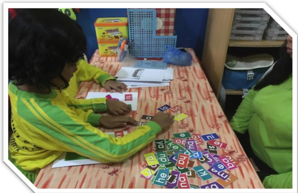
Gambar 2. Anak mengucapkan huruf dengan kartu huruf