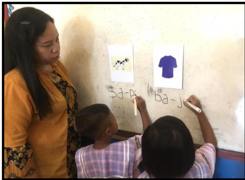
Gambar 8. Anak menulis kata