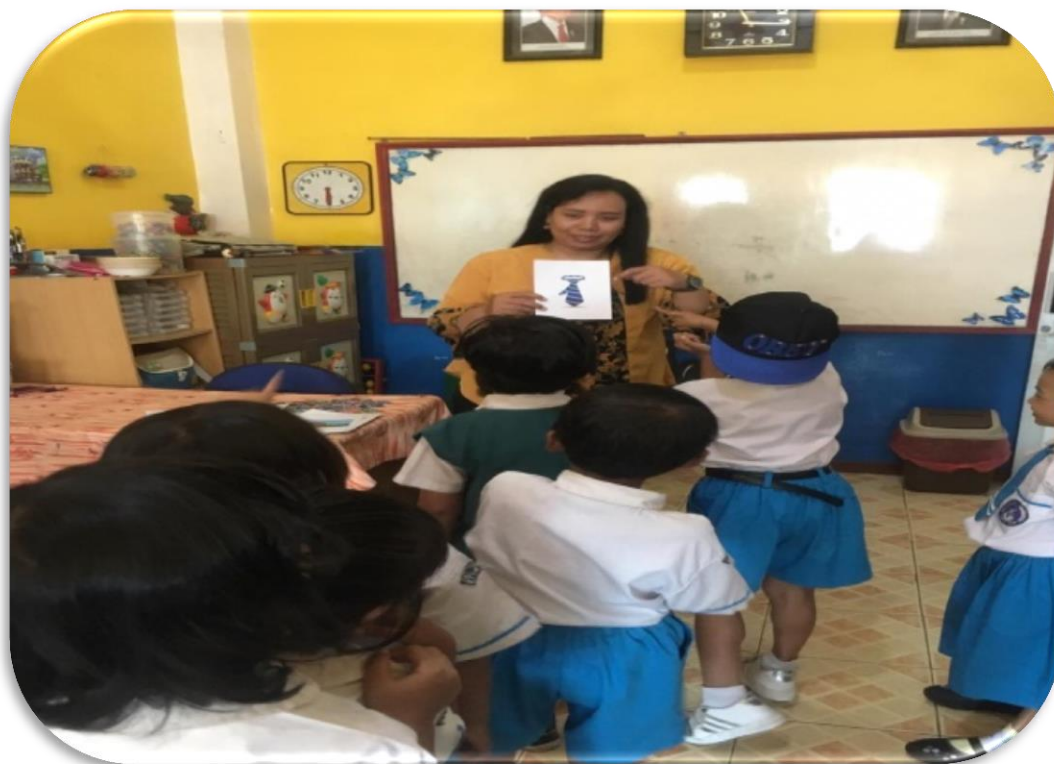
Gambar 4. Anak menebak gambar