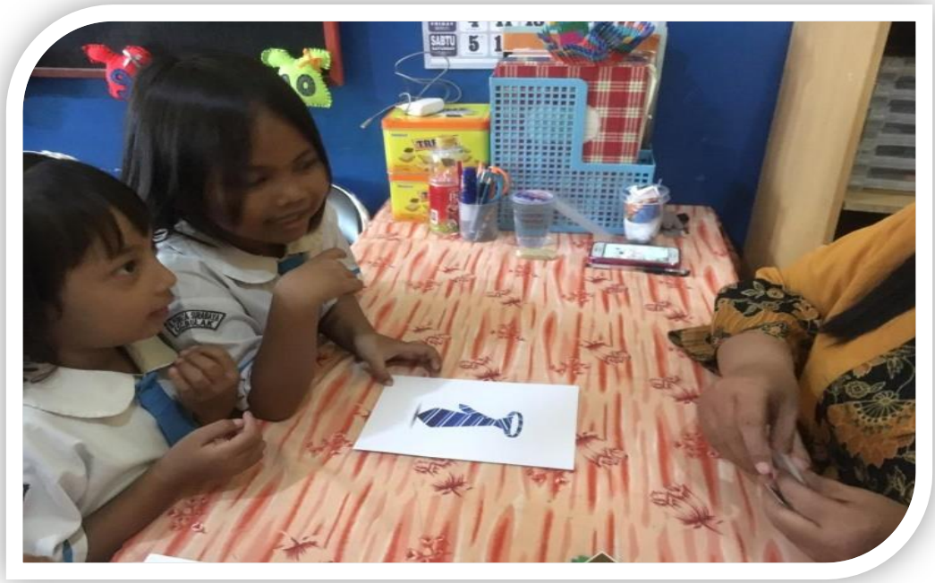
Gambar 5. Anak menyusun huruf menjadi kata