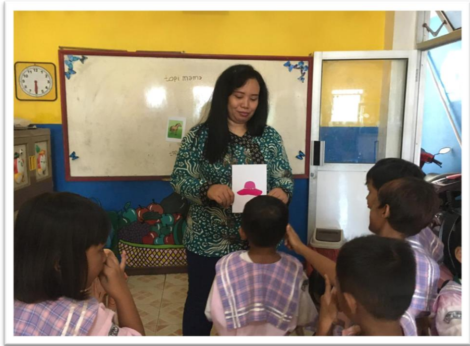
Gambar 9. Guru mengajak anak menyebutkan gambar