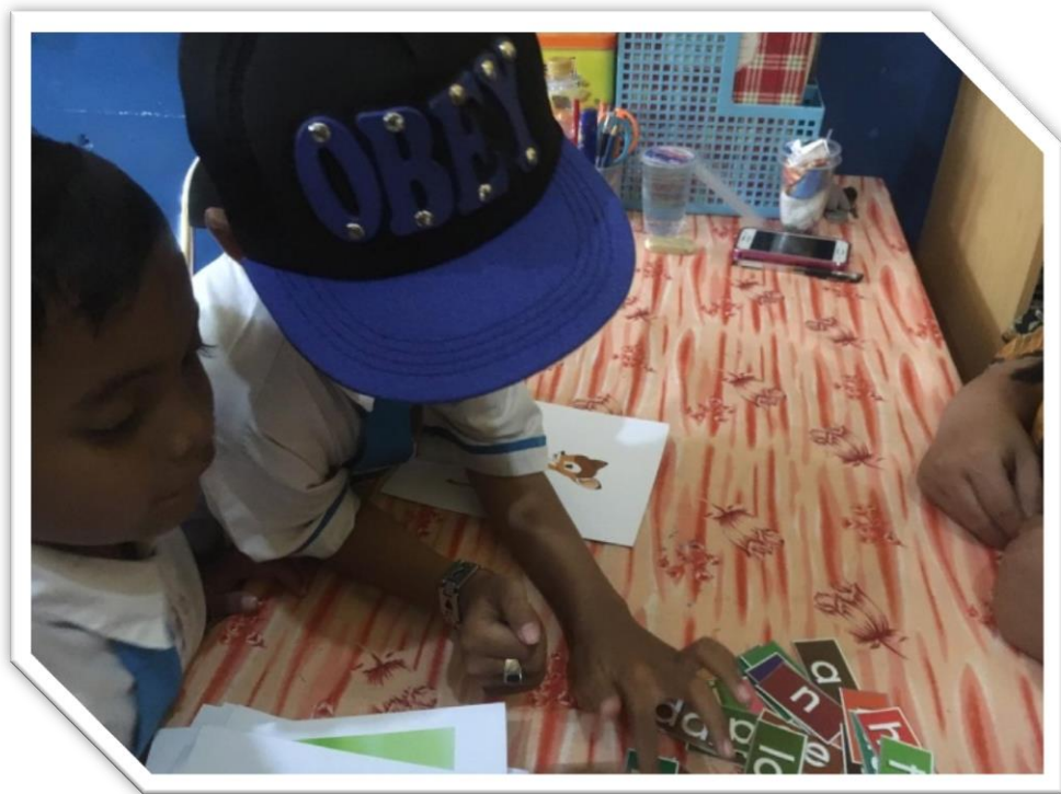
Gambar 6. Anak menyusun huruf menjadi kata