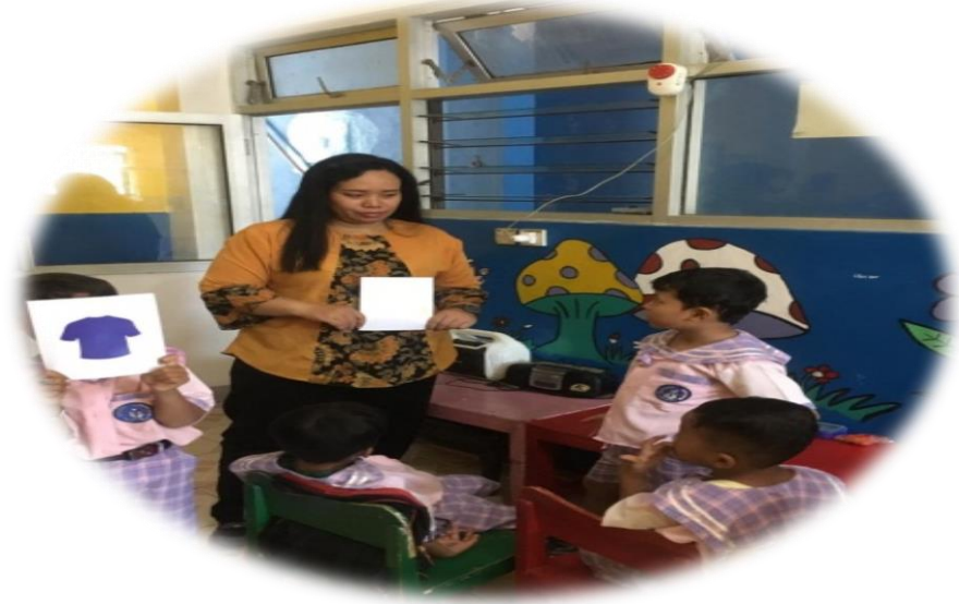
Gambar 7. Guru memberi contoh membuat kalimat