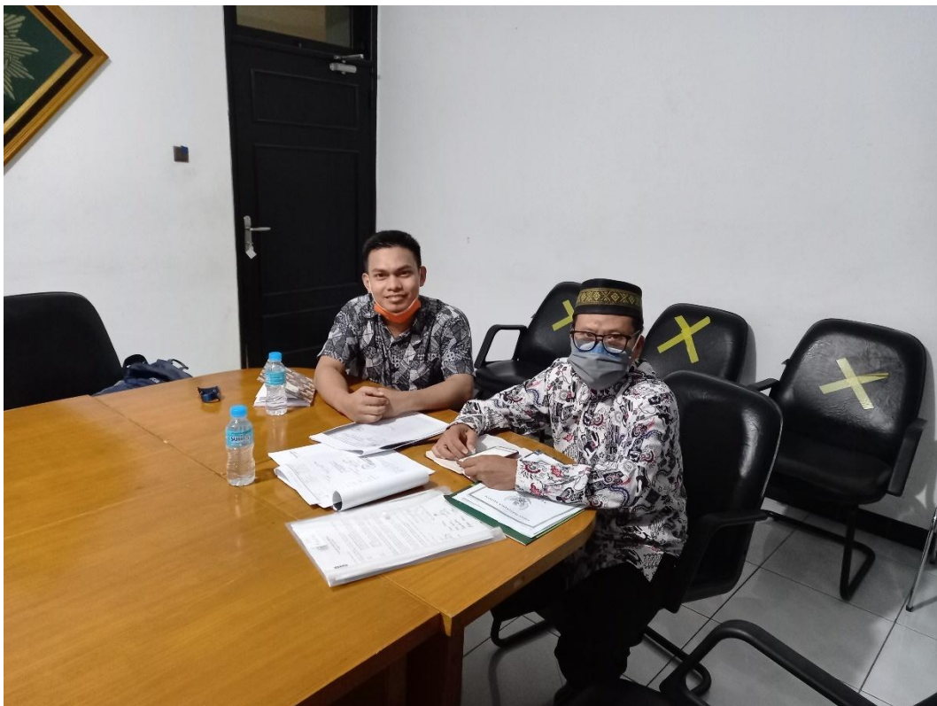
Foto Penelitian di Kantor PDM Kota Surabaya, Jl. Wuni No. 09 Surabaya