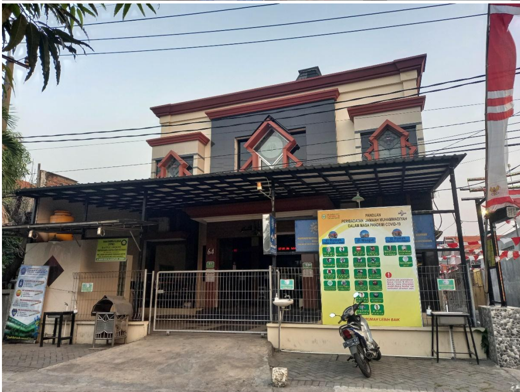
Foto Sampling penelitian di Masjid Baitul Arqom Kedurus