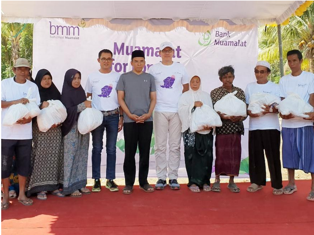
Penyaluran dana untuk korban bencana