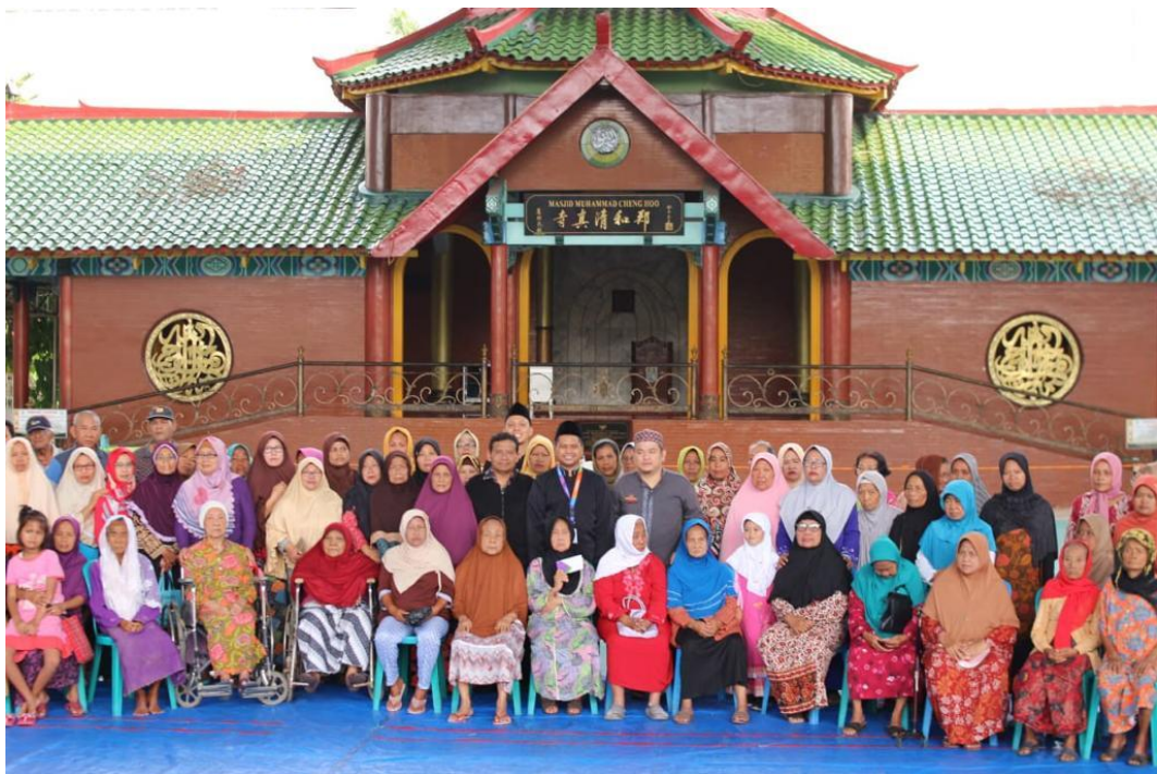
Penyaluran dana PAUD