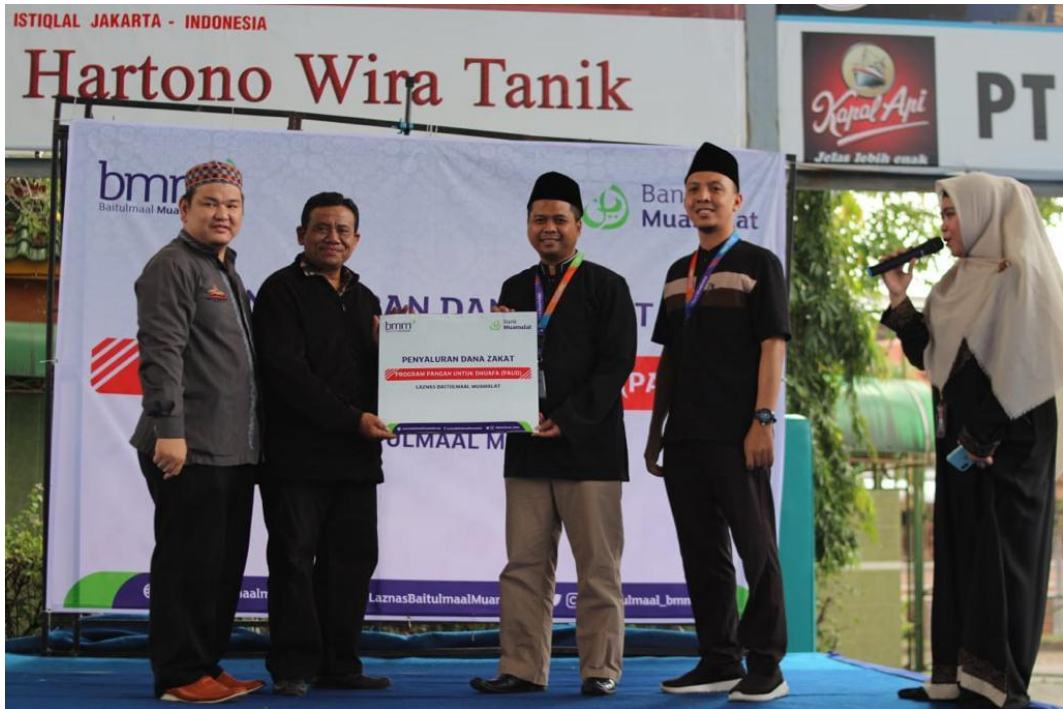
Penyaluran dana PAUD