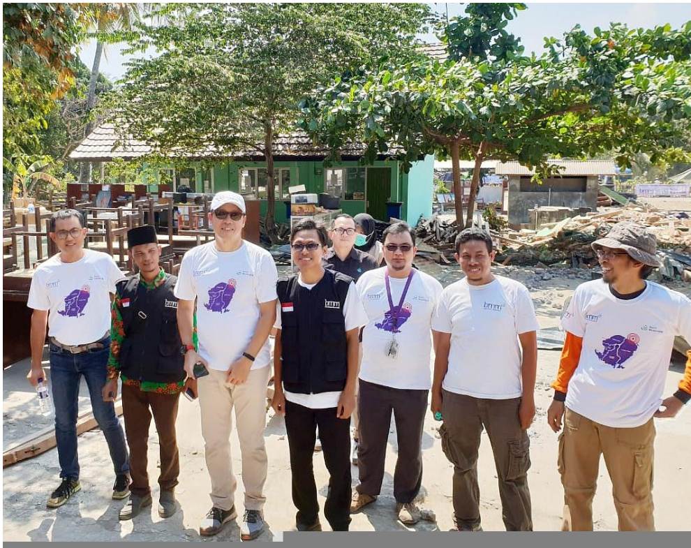
Penyaluran dana untuk korban bencana