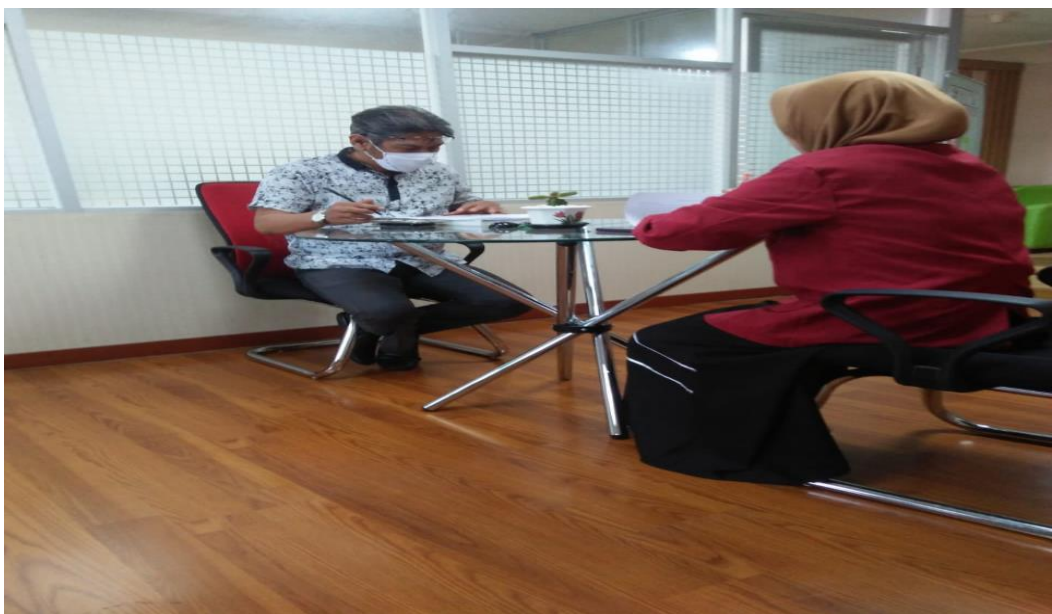
Wawancara dengan Staf Subid Pembinaan Pegawai BKD Kota Surabaya