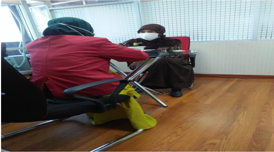
Wawancara dengan Kasubid Pembinaan Pegawai BKD Kota Surabaya