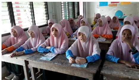
Suasana kelas pada waktu mata pelajaran Pendidikan Agama Islam