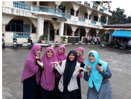
Profil bangunan sekolah tampak depan dokumentasi Bersama siswa