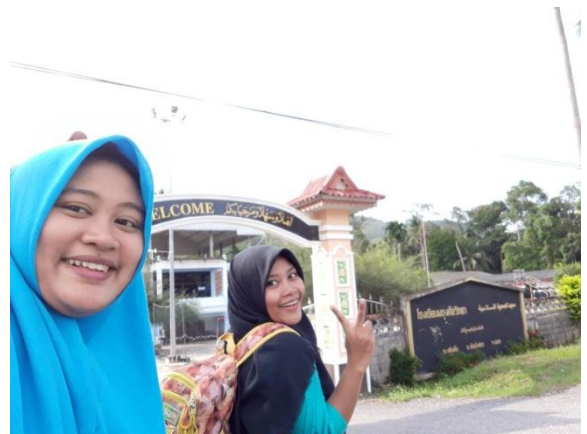
Foto sekolah tampak depan gerbang