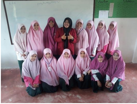
Foto Bersama siswi Broken Home