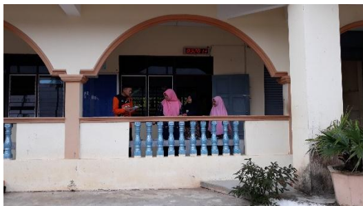
Pendekatan diri kepada siswa dengan menggunakan metode komunikasi NLP ( Neuro Linguistic Programing )