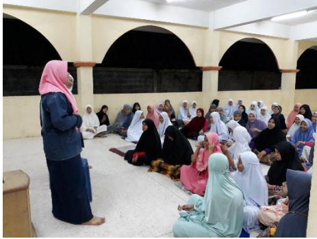
Penerapan metode NLP ( Neuro Linguistic Programing )