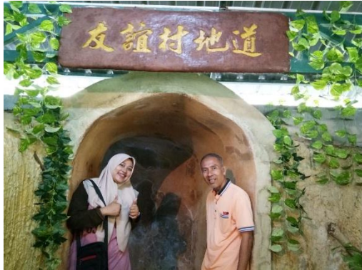
Foto bersama Director Phadungsil Wittaya School Thailand pada saat wisata di Piramik Thailand