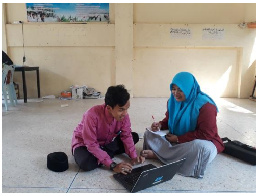
Pendekatan secara langsung dengan siswa Broken Home dengan menerapkan metode komunikasi NLP ( Neuro Linguistic Programing )