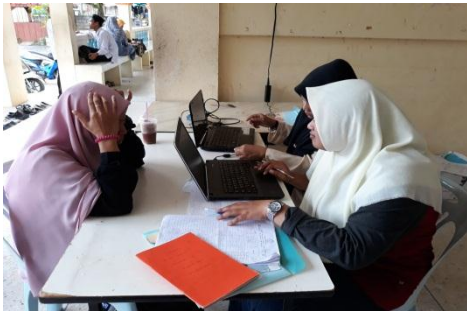
Wawancara Kondisi keseharian Siswa Broken Home