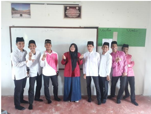
Foto Bersama siswa Broken Home , tampak wajah ceria setelah menggunakan metode komunikasi NLP ( Neuro Linguistic Programing )