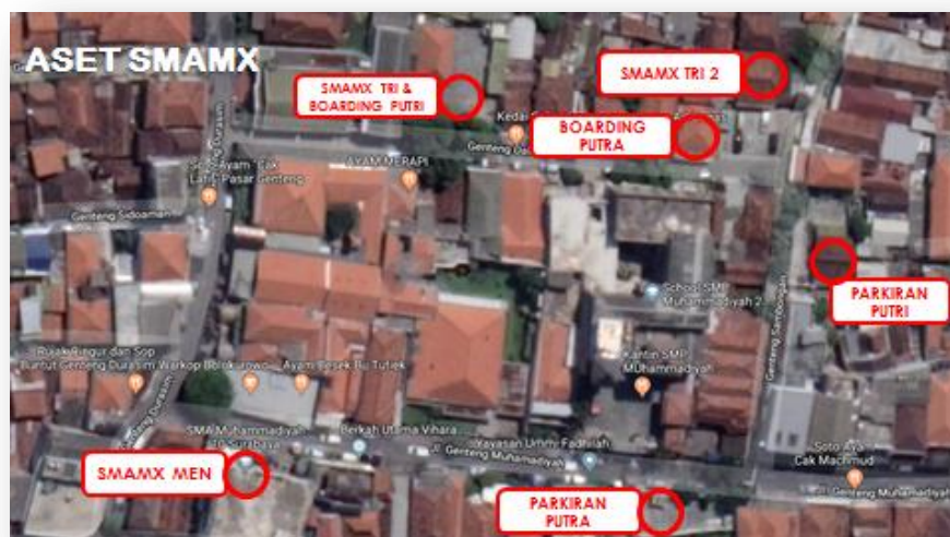
Gambar 41 Letak Georgrafis

SMA Muhammadiyah ini ada di Jl. Genteng Muhammadiyah No. 45 Surabaya. Sekolah ini dengan pimpinan kepala sekolahnya yaitu Bapak Sudarusman, S.T. SMA Muhammadiyah 10 Surabaya ini terletak di tengah-tengah kota surabaya yang berada di timurnya SMP Muhammadiyah 2 Surabaya , utaranya Pasar Genteng Baru dan baratnya Rujak Cingur Durasim.