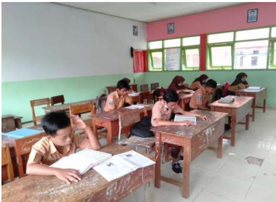
Gambar 5.8. Kegiatan Membaca Al-Qur'an Siswa Kelas VIII B