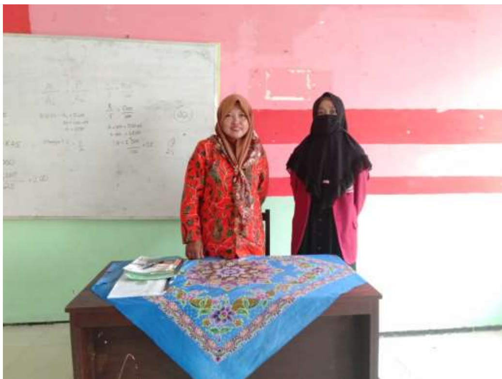
Gambar 5.10. Foto Bersama Guru PAI Kelas VIII B