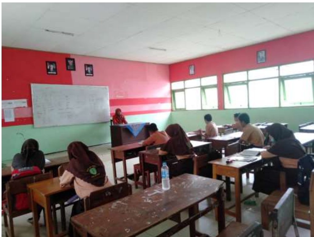
Gambar 5.9. Kegiatan Membaca Al-Qur'an Siswa Kelas VIII B