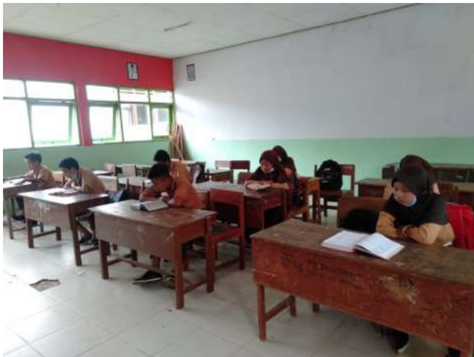
Gambar 5.7. Kegiatan Membaca Al-Qur'an Siswa Kelas VIII B