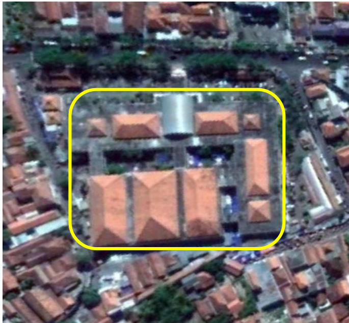
Gambar 3.1 Peta Lokasi Pasar Srimangunan Sampang

Penelitian ini berlokasi di Pasar Srimangunan Sampang khususnya pada lahan parkir. Pertimbangan pemilihan lokasi ini dikarenakan Pasar Srimangunan Sampang yang strategis dan berada di Kabupaten Sampang.