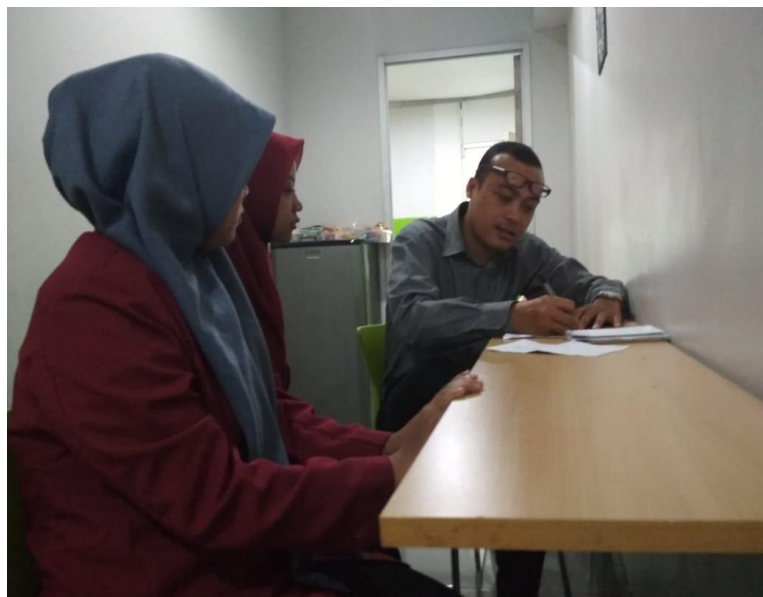
Gambar Ketika Melakukan Penelitian