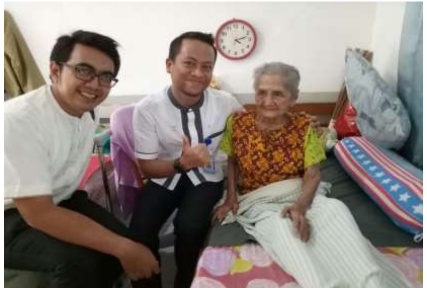
Kegiatan CSR BSB Kantor Cabang Darmo Surabaya Berbagi mengunjungi Panti Jompo