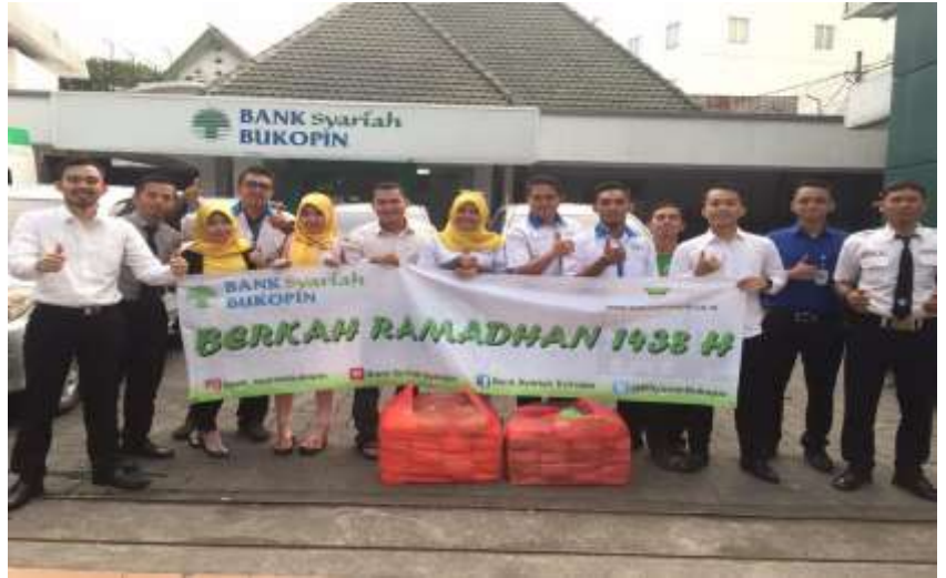
Kegiatan CSR Berbagi Berkah Ramadhan dan bagi-bagi takjil BSB Kantor Cabang Darmo Surabaya