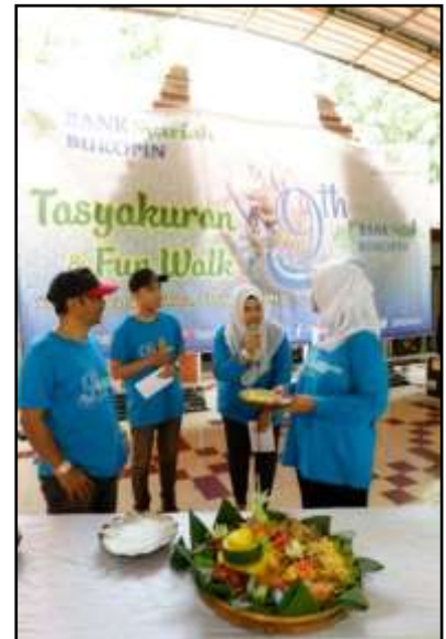
Tasyakuran Milad ke-9 BSB Kantor Cabang Darmo Surabaya