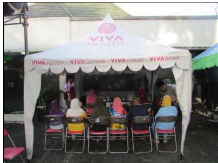
Kegiatan CSR berupa Senam untuk Umum dan Medical Check Up