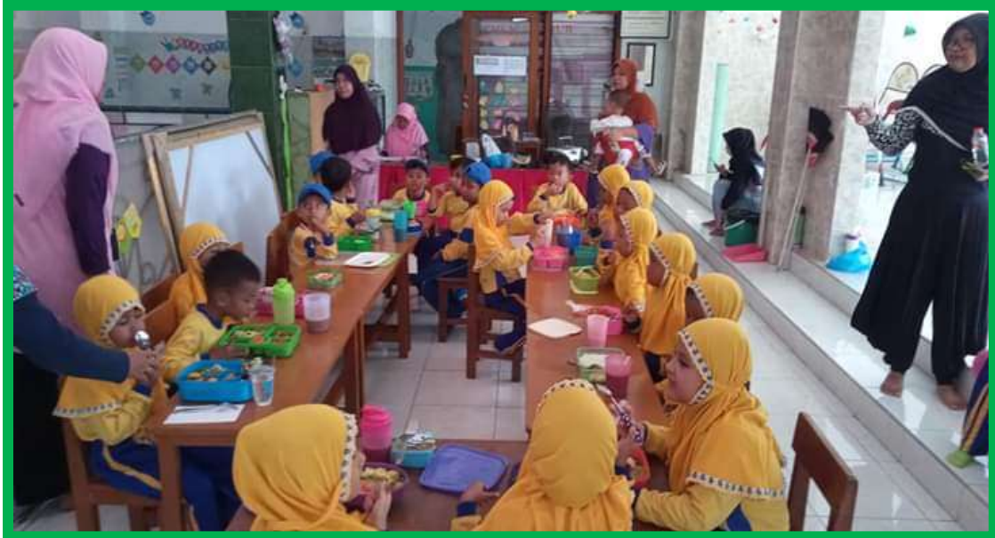
Gambar 1 Anak mengkonsumsi hasil kreasi makanan sehat