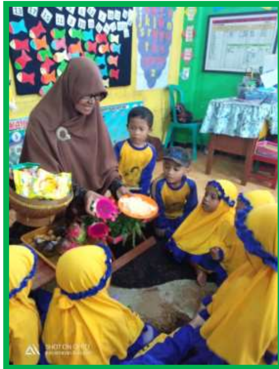
Gambar 3 Anak mengenal buah-buahan yang menyehatkan