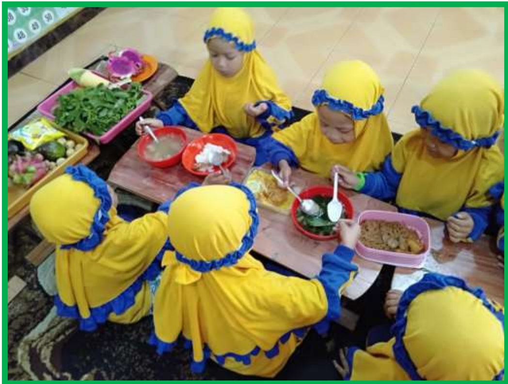
Gambar 9 Anak senang mengkonsumsi makanan sehat yang disediakan guru