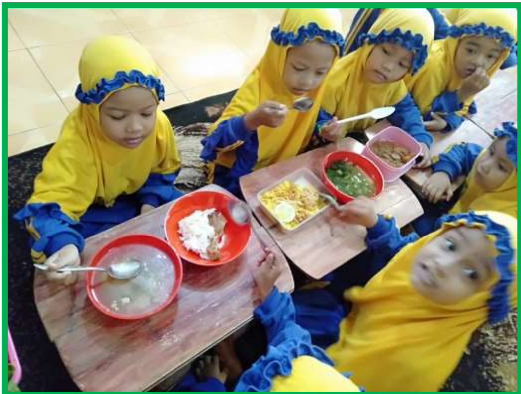
Gambar 10 Anak senang mengkonsumsi makanan sehat yang disediakan guru