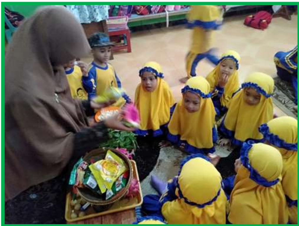
Gambar 4 Anak menyebutkan nama buah-buahan yang menyehatkan