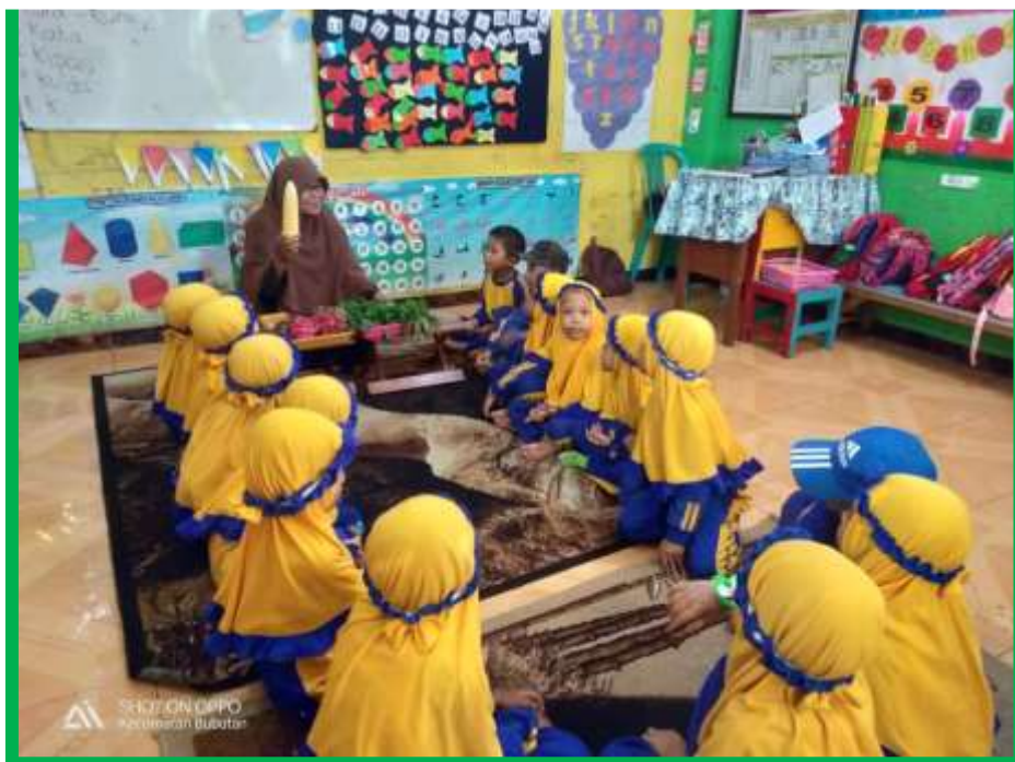
Gambar 8 Anak menyebutkan macam-macam sayuran yang menyehatkan