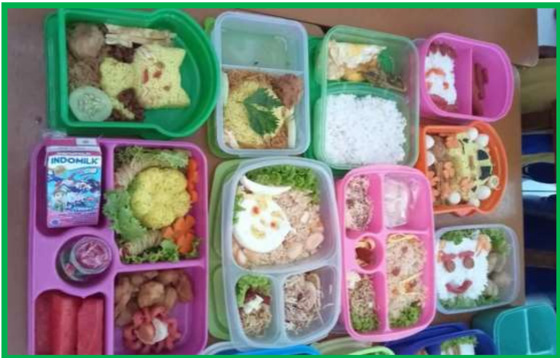
Gambar 2 Hasil kreasi makanan sehat