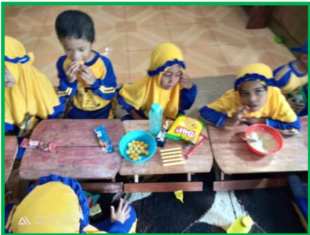
Gambar 6 Anak membedakan makanan sehat dan tidak sehat untuk dikonsumsi