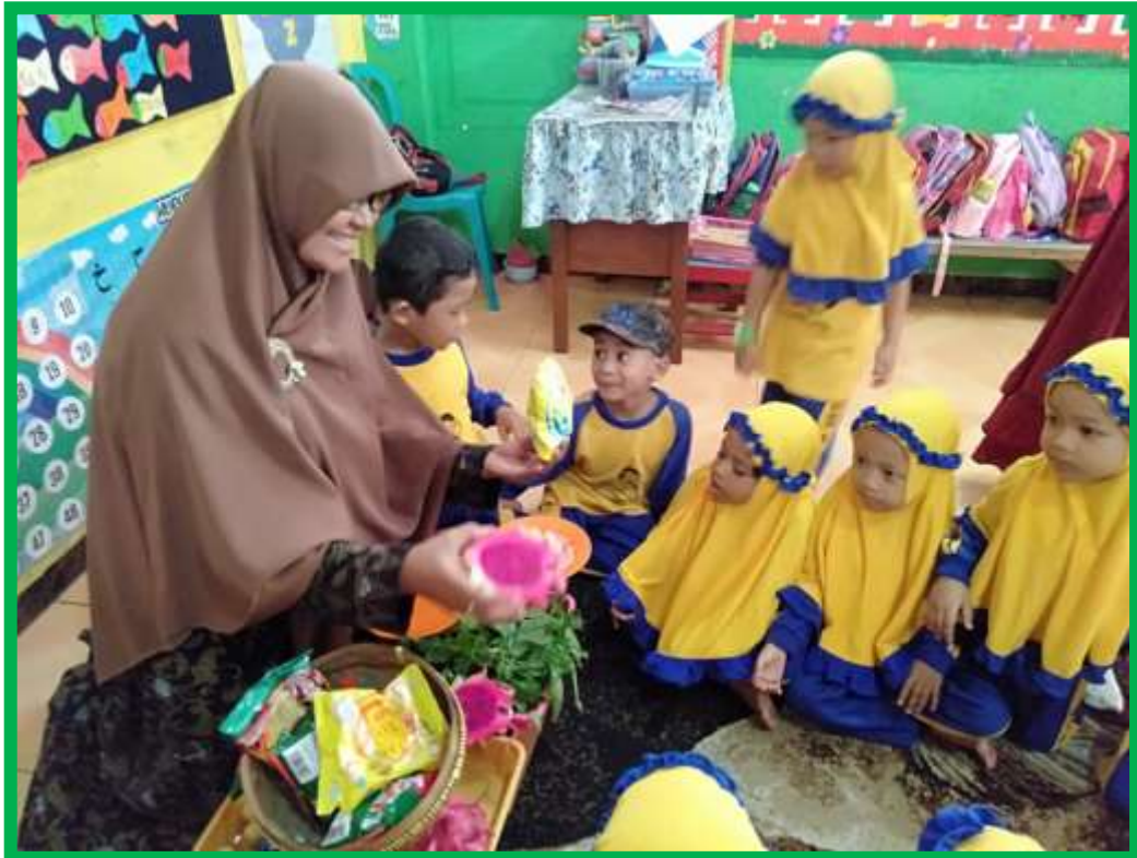
Gambar 5 Anak diberikan penjelasan perbedaan makanan sehat dan tidak sehat