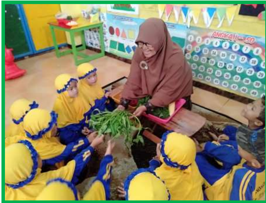
Gambar 7 Anak dikenalkan macam-macam sayuran yang menyehatkan