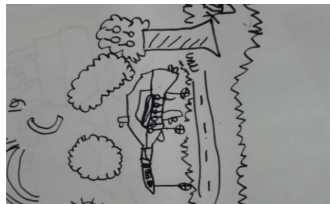
Karya dengan teknik gambar bebas