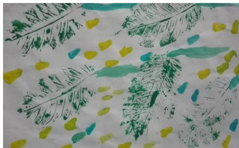
Karya dengan teknik stempel