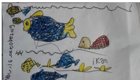
Karya dengan teknik gambar bebas