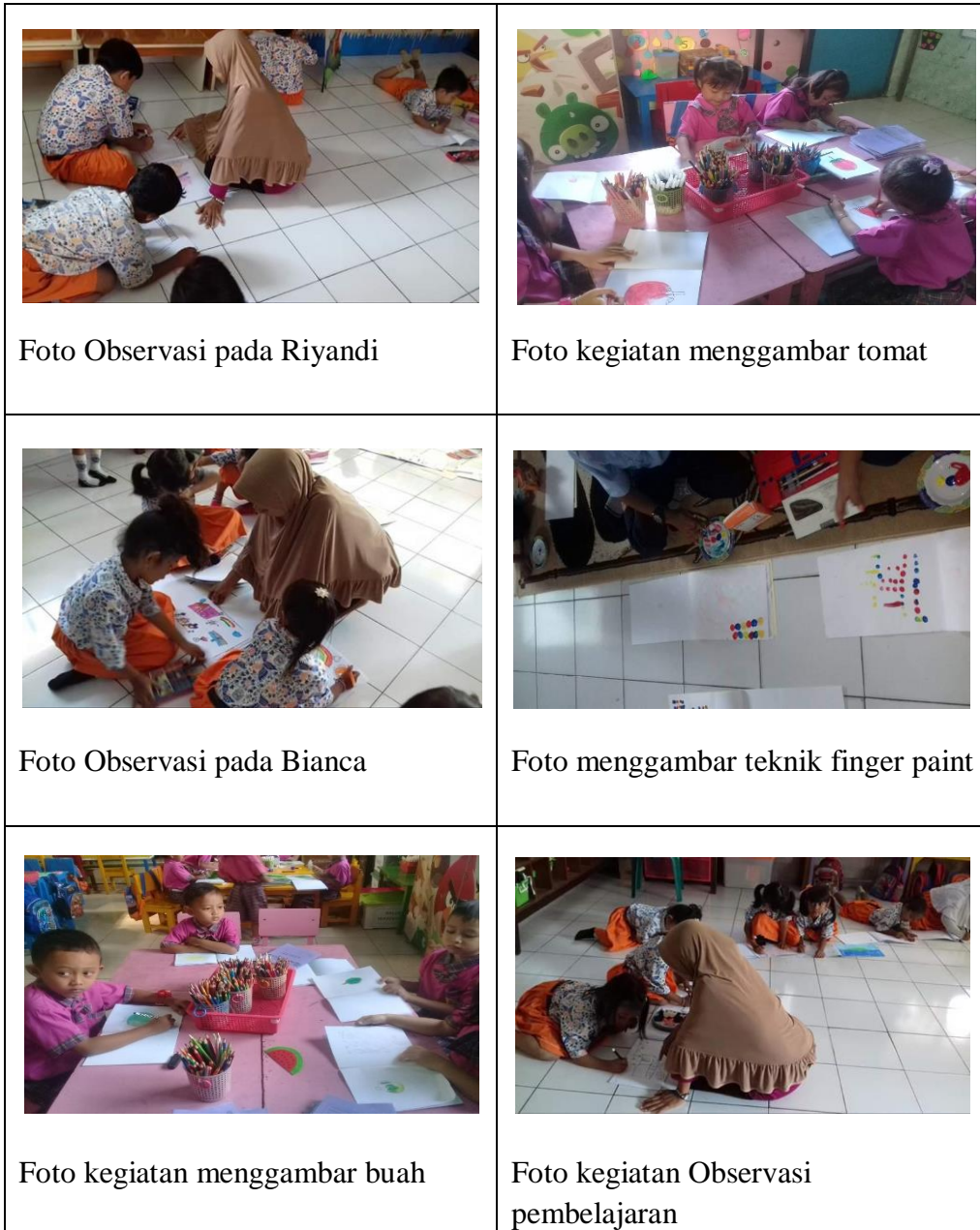
Foto kegiatan observasi pembelajaran kreativitas menggambar