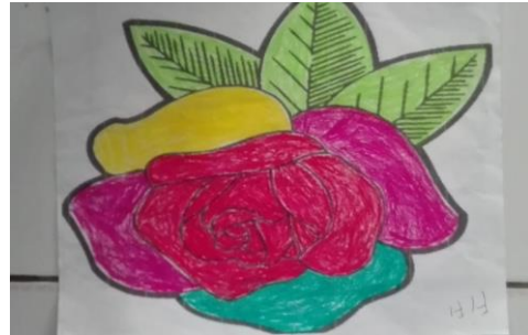
Karya dengan teknik mewarnai