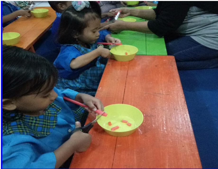
Gambar 10. Peran guru membantu perkembangan motorik halus anak usia 2-3 tahun dengan menggerakkan jari tangan di PPT Permata Surabaya