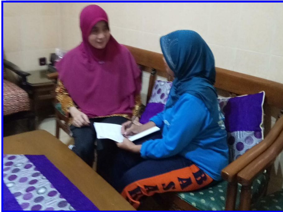
Gambar 5. Peneliti melakukan kegiatan wawancara pada orang tua Saka anak yang kurang berkembang motorik halusnya di PPT Permata Surabaya