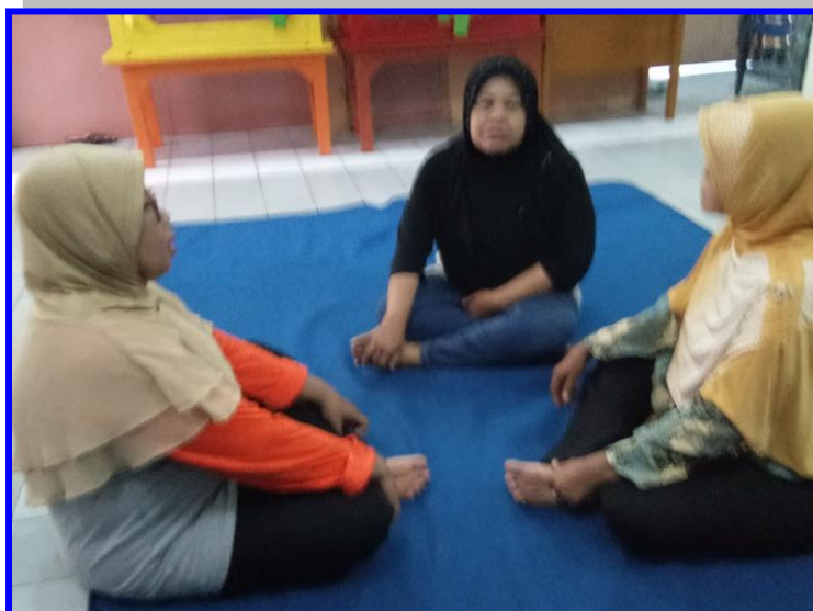
Gambar 2. Peneliti melakukan kegiatan wawancara pada guru/ bunda anak usia 2-3 tahun di PPT Permata Surabaya