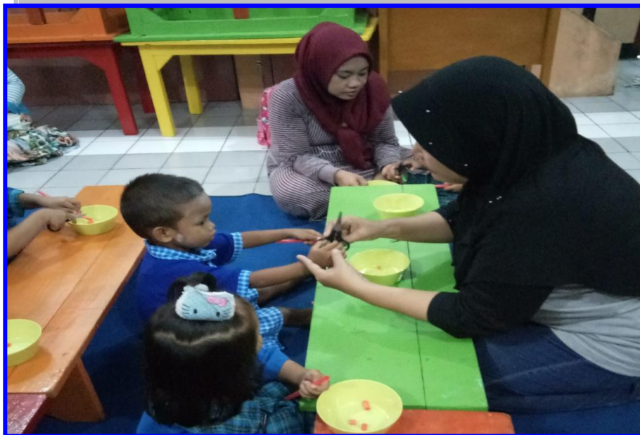
Gambar 6. Peran guru membantu perkembangan motorik halus anak usia 2-3 tahun dengan menggerakkan jari tangan di PPT Permata Surabaya