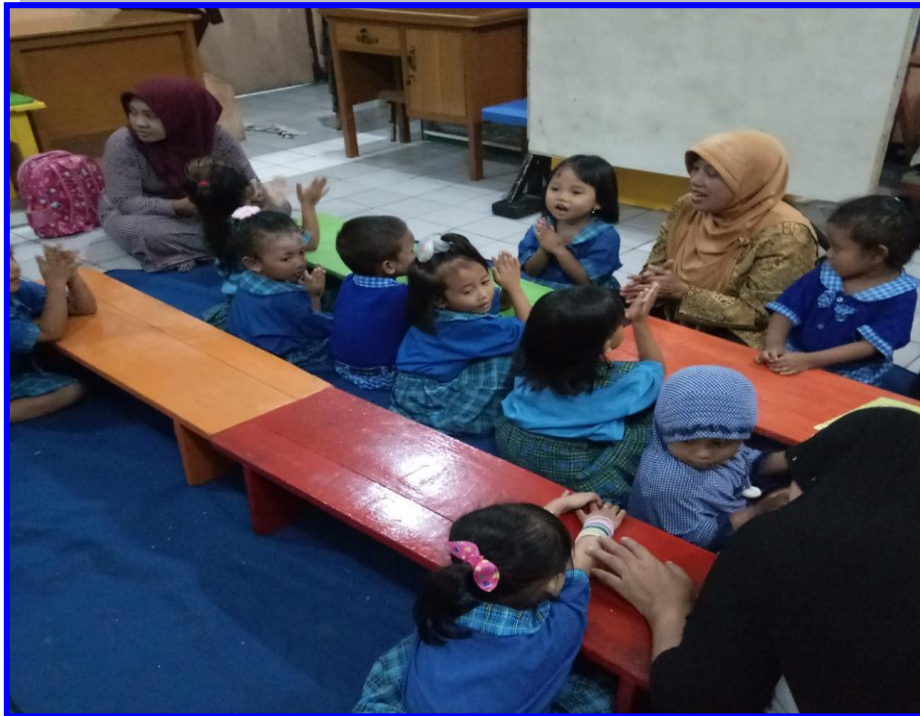
Gambar 9. Anak usia 2-3 tahun melakukan kegiatan perkembangan motorik halus menggerakkan pergelangan tangan di PPT Permata Surabaya