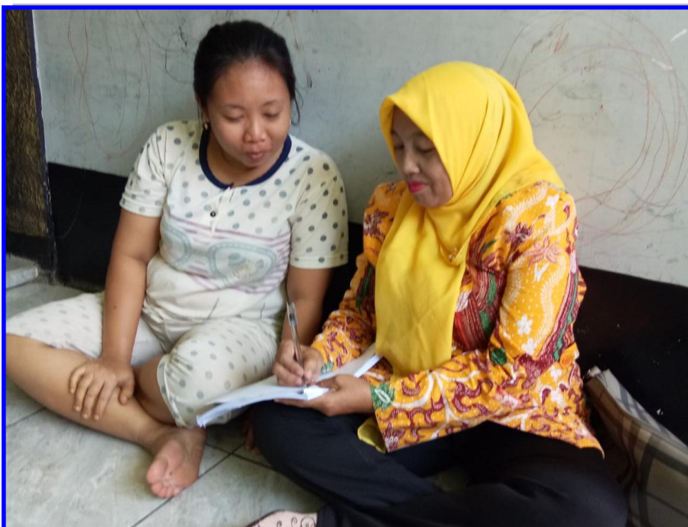
Gambar 4. Peneliti melakukan kegiatan wawancara pada orang tua Abida anak yang kurang berkembang motorik halusnya di PPT Permata Surabaya