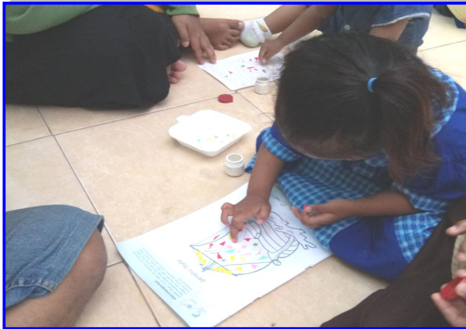
Gambar 7. Anak usia 2-3 tahun melakukan kegiatan perkembangan motorik halus koordinasi mata dengan tangan di PPT Permata Surabaya