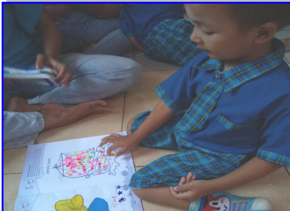
Gambar 8. Anak usia 2-3 tahun melakukan kegiatan perkembangan motorik halus koordinasi mata dengan tangan di PPT Permata Surabaya