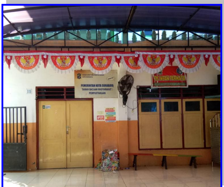
Gambar 1. Tempat Penelitian di PPT Permata Surabaya