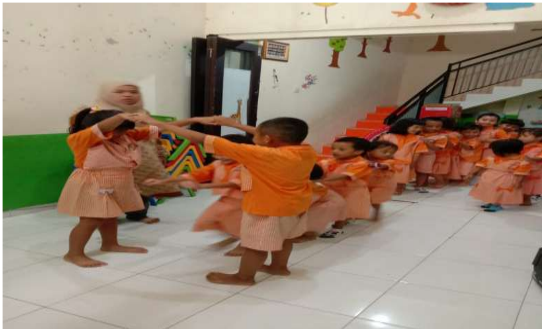
Gambar 9. Anak memainkan permainan Ular Naga, permainan ini membutuhkan kerjasama satu sama lainnya.