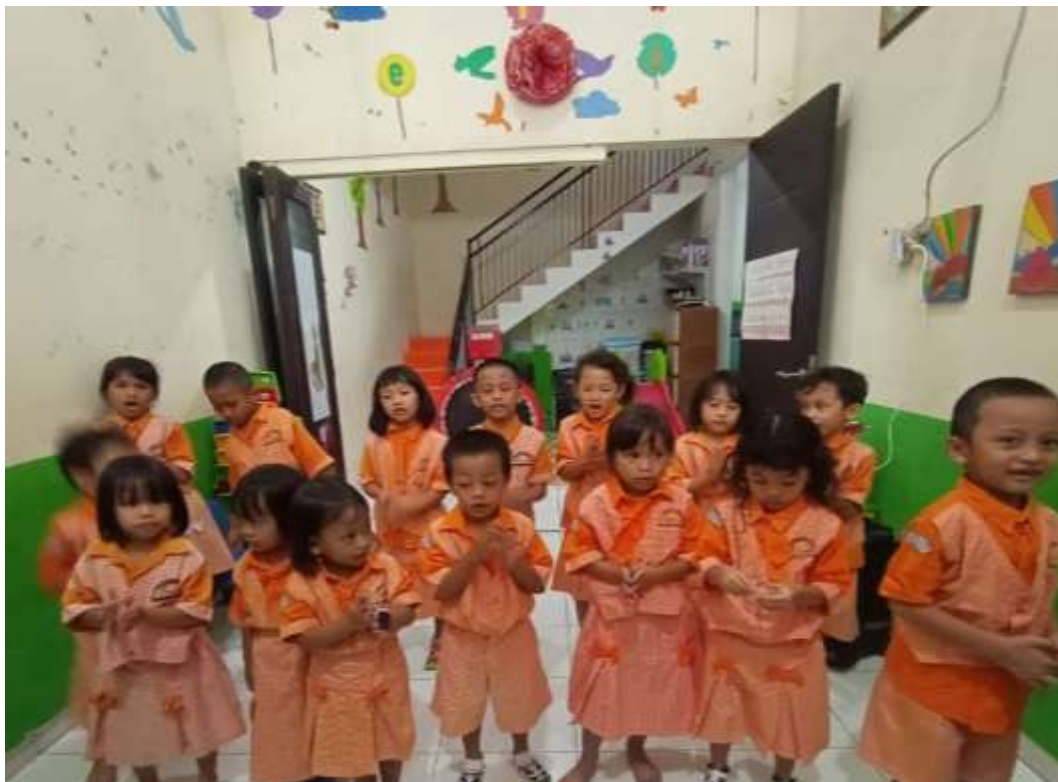
Gambar 2. Kegiatan anak-anak menyanyikan lagu guruku