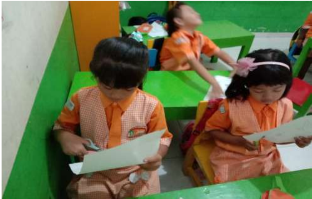
Gambar 7. Anak belajar menggunting gambar baju dokter lalu menempelkan pada kertas .