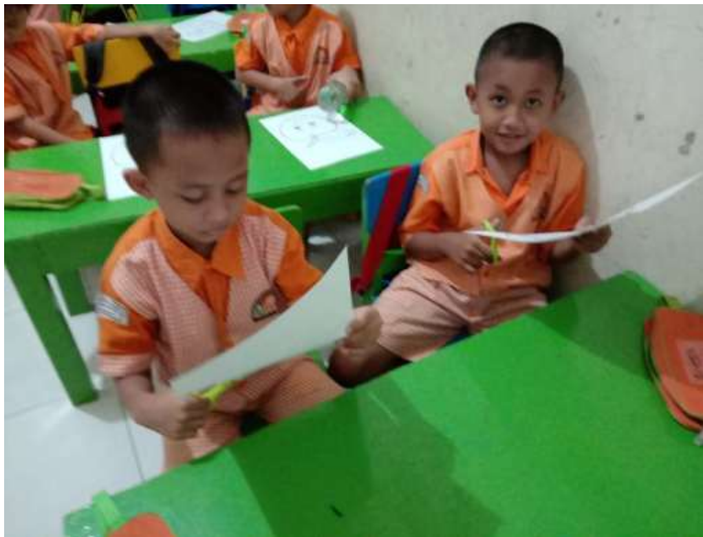
Gambar 8. Anak belajar menggunting bebas sesuai perintah bu guru dikelas