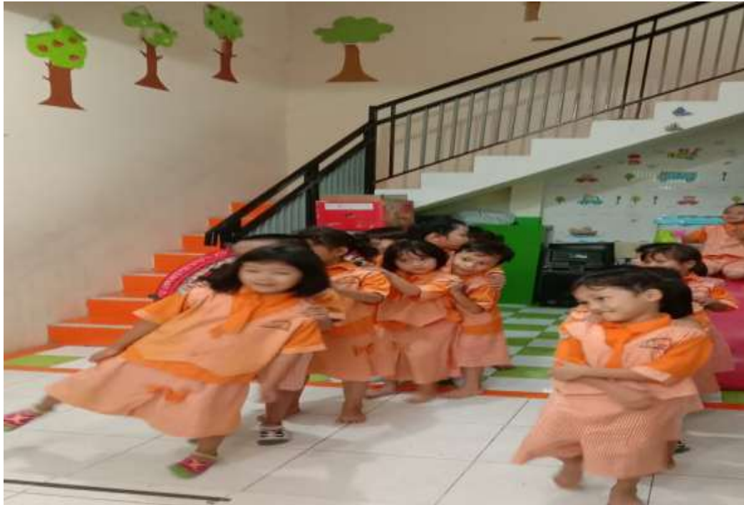
Gambar 1. Anak – anak belajar baris-berbaris di ruang Aula kelas