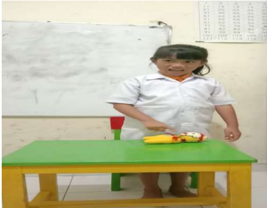
Gambar 3. Bermain peran sebagai dokter, menjelaskan cara menangani pasien