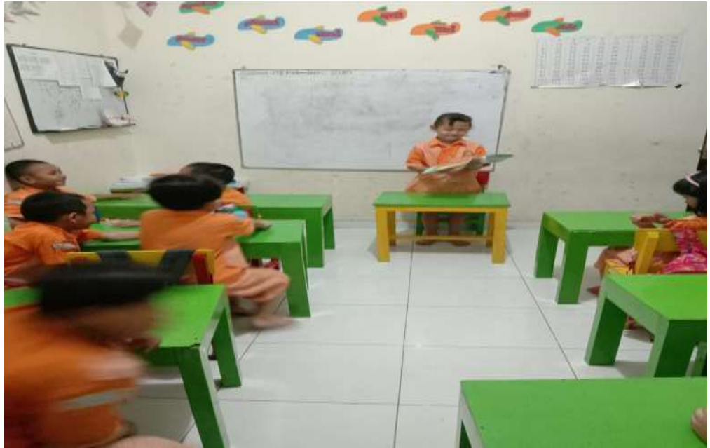
Gambar 5. Bermain peran anak menjadi seorang bu guru dikelas, Membacakan buku cerita ke murid.