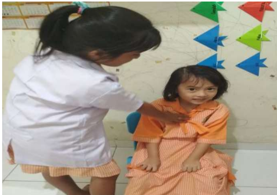
Gambar 4. Bermain peran sebagai dokter, cara memeriksa pasien yang sakit