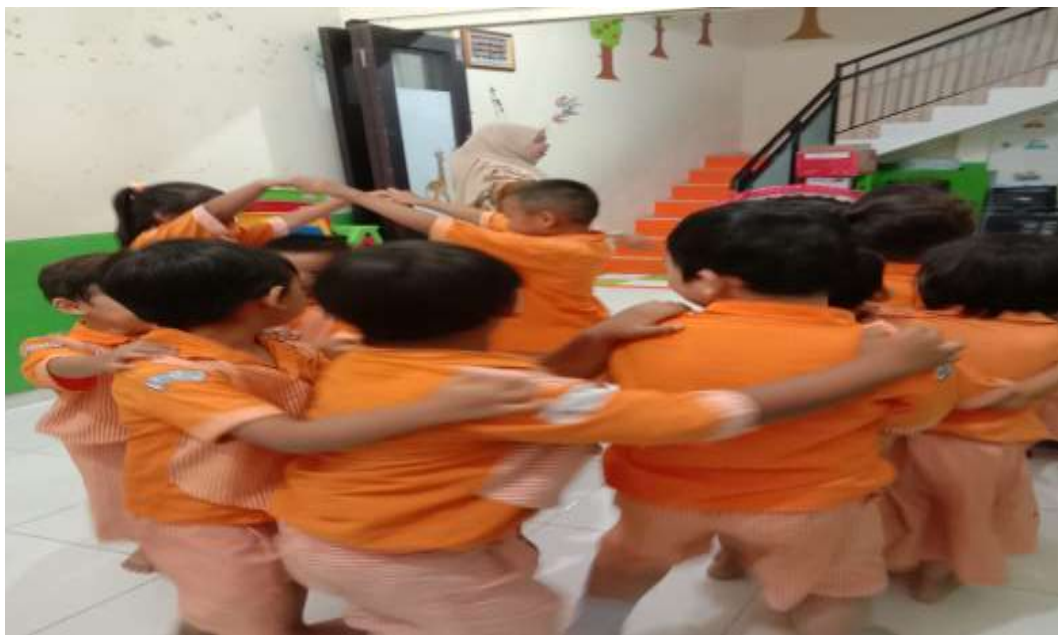
Gambar 10. Anak belajar bekerjasama, sabar menunggu giliran/antri dan mengikuti aturan dalam permainan.