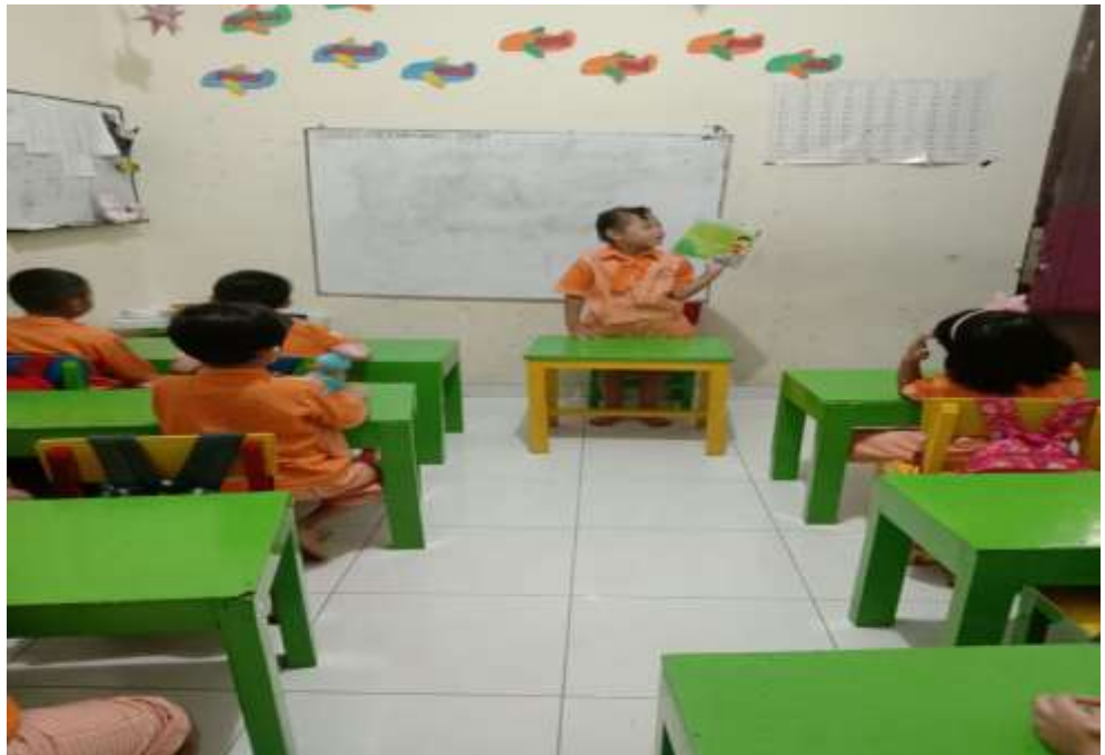
Gambar 6. Berperan sebagai bu guru menceritakan dan menunjukkan kemurid buka apa yang sedang dibacakan.