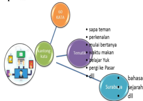
Gambar 1. Tampilan Nemo Sesuai Desain Aplikasi