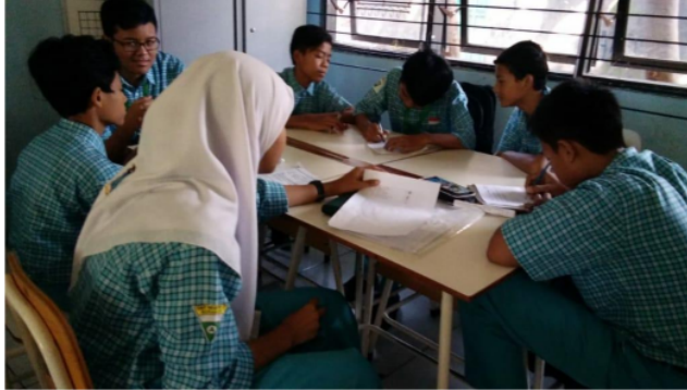
Gambar 1. Suasana Diskusi dalam Kelompok

menemukan jawaban dan cara menjawab masalah, diskusi dengan teman, serta mempresentasikan hasil diskusi. Untuk aktivitas menemukan jawaban dan diskusi, rata-rata waktu yang digunakan lebih singkat dari rentang waktu toleransi. Hal tersebut terjadi karena belum semua siswa yang tergabung dalam kelompok berpartisipasi aktif dan masih ada yang sibuk sendiri seperti diberikan pada Gambar 1.