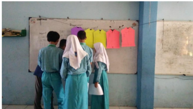
Gambar 1. Siswa Mempresentasikan Hasil Diskusi Kelompok

Sedangkan rata-rata waktu untuk mempresentasikan hasil melebihi rentang waktu toleransi, artinya dibutuhkan waktu yang lebih lama saat siswa menjelaskan hasil diskusi kelompoknya di depan kelas seperti Gambar 2. Hal ini terjadi karena siswa belum terbiasa untuk melakukan aktivitas presentasi di depan kelas, serta belum semua siswa terlibat aktif saat diskusi kelompok. Namun demikian, apabila ini dibiasakan maka tidak menutup kemungkinan siswa akan menjadi terbiasa sehingga menjadi lebih efektif.