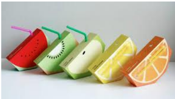
Gambar 2: Kemasan Jus Buah disesuaikan dengan isi produk dan Ramah Lingkungan

Inovasi proses didefinisikan sebagai perbaikan signifikan pada metode produksi maupun pengiriman produk, baik teknis, peralatan maupun perangkat lunak. Sementara inovasi pemasaran adalah metode pemasaran baru yang melibatkan perubahan signifikan dalam design atau pengemasan produk, penempatan produk, promosi produk atau harga. Contohnya saja kemasan produk jus buah yang disesuaikan dengan isi kemasan.