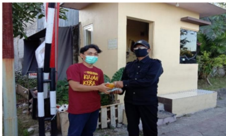
Gambar 2: Pembagian Masker dan Jamu Imunitas Kepada Warga Tidak lupa juga ketika melakukan semua kegiatan dan berinteraksi dengan masyarakat saya selalu

handsantizer. Hal ini dilakukan bertujuan agar warga selalu antisipasi terhadap penyebaran covid-19. Banyak warga yang menyambut dengan baik kegiatan tersebut, memberikan apresiasi serta support lebih terhadap kegiatan tersebut. Selain itu, kegiatan lain yang dilakukan adalah berbagi jamu untuk warga Rungkut. Jamu ini diproduksi dari rempah-rempah seperti jahe, kunir, kencur, serai dan lainnya dengan khasiatnya yaitu menambah imunitas tubuh. Jamu ini bisa meningkatkan imun tubuh serta menambah kebugaran tubuh.