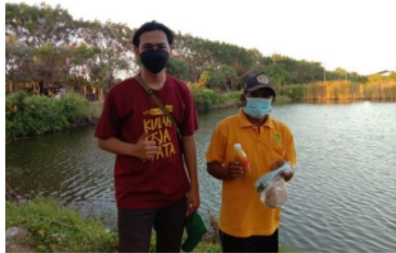
Gambar 3: Pembagian Masker dan Sosialisasi kepada Warga

Sosialisasi dilakukan secara face to face oleh tim KKN Rungkut 2 yang terdiri dari 10 Mahasiswa Universitas Muhammadiyah Surabaya. Edukasi penggunaan masker medis agar efektif, yang telah disampaikan ke masyarakat yaitu :