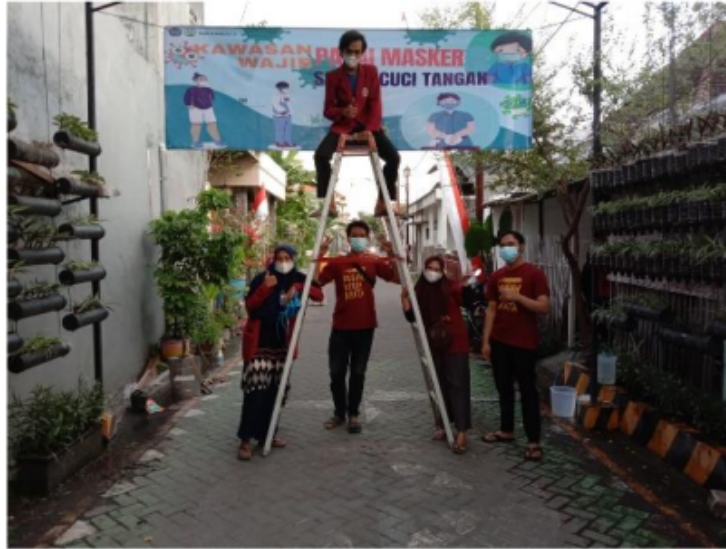
Gambar 1: Pemasangan Banner Himbauan Penerapan Protokol Kesehatan

Covid-19 dan waktu itu jumlah oksigen masih sangat kurang untuk pasien. Meskipun banyak korban yang berjatuh para pemerintah tetap melakukan pembatasan dengan tujuan agar tidak ada lagi korban.