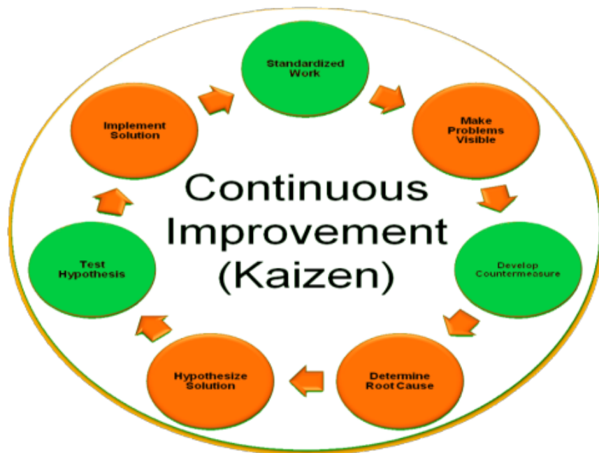
Gambar 3: Diagram Alir Continuous Improvement

Continuous Improvement adalah usaha atau upaya berkelanjutan yang dilakukan untuk mengembangkan dan memperbaiki produk, pelayanan maupun proses (Bhuiyan & Baghel, 2005). Usaha-usaha tersebut bertujuan untuk mencari dan mendapatkan bentuk terbaik dari improvement yang dihasilkan (Bessant et al., 1994). Menciptakan solusi terbaik dari masalah yang ada, yang hasilnya akan terus bertahan dan berkembang lebih baik lagi. Menurut Gaspersz (2006), konsep lean manufacturing merupakan suatu upaya strategi perbaikan secara kontinu dalam proses produksi untuk mengidentifikasi jenis-jenis dan faktor penyebab terjadinya waste agar aliran nilai ( value stream ) dapat berjalan lancar sehingga waktu produksi lebih efisien. Proses kerja continuous improvement digambarkan melalui diagram alir berikut: