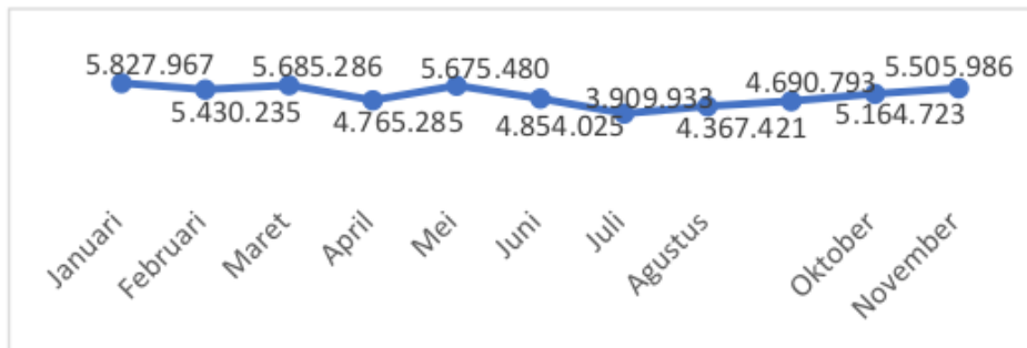
Gambar 1: Perkembangan Rata-rata Omset Perbulan Pelaku UMKM Kota Surabaya Tahun 2021

pelaku usaha binaan, menjembatani kemitraan antara pelaku UMKM dengan perbankan sebagai sarana peningkatan modal usaha dsb. Melalui kegiatan-kegiatan tersebut, terdapat pelaku UMKM yang selama ini telah menjadi binaan pemerintah. Rata-rata omset pertahun UMKM di Kota Surabaya sebesar Rp55.500.000 pada tahun 2021 dengan fluktuasi setiap bulannya.