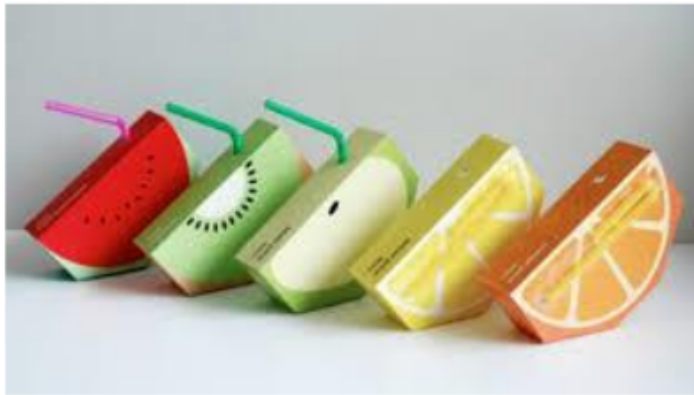
Gambar 2: Kemasan Jus Buah disesuaikan dengan isi produk dan Ramah Lingkungan

Inovasi proses didefinisikan sebagai perbaikan signifikan pada metode produksi maupun pengiriman produk, baik teknis, peralatan maupun perangkat lunak. Sementara inovasi pemasaran adalah metode pemasaran baru yang melibatkan perubahan signifikan dalam design atau pengemasan produk, penempatan produk, promosi produk atau harga. Contohnya saja kemasan produk jus buah yang disesuaikan dengan isi kemasan.