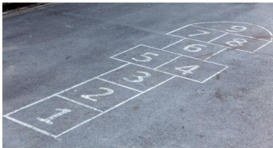
Gambar 2.1 Gambar bidang permainan taplak gunung

Permainan tradisional taplak gunung adalah permainan tradisional dengan menggunakan bidang lapangan berbentuk delapan kotak dan setengah lingkaran di bagian atas. Permainan tradisional ini dilakukan oleh dua orang atau lebih dipertandingkan dengan cara berkompetisi atau bersaing antar pemain, pemenang dari permainan tersebut dibuktikan dengan banyaknya bintang/tanda pada setiap kotak sebagai tanda bahwa kotak tersebut adalah miliknya.