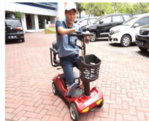
Gambar 2: Pengaplikasian Bima Tutuk pada penyandang disabilitas