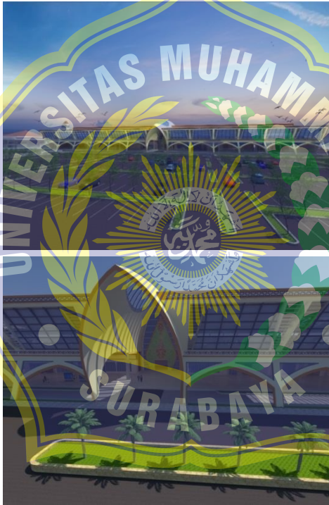
Gambar 6.3 Denah desain bandar udara Kabupaten Pacitan

Bentuk bangunan pada bandar udara di Pacitan mengambil dari hasil analisa kondisi di wilayah Pacitan yang di dominasi dengan pegunungan, gua, dan laut juga tradisi wayangan dan tari. Dengan mengangkat kearifan lokal untuk memperkenalkan Kabupaten Pacitan maka hasil analisa tersebut diolah dan ditampilkan pada facade bangunan bandar udara Kabupaten Pacitan dengan semenarik mungkin untuk memberikan kesan kepada pengunjung.