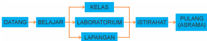
Gambar 4.6.B Diagram Sirkulasi Siswa (Taruna)