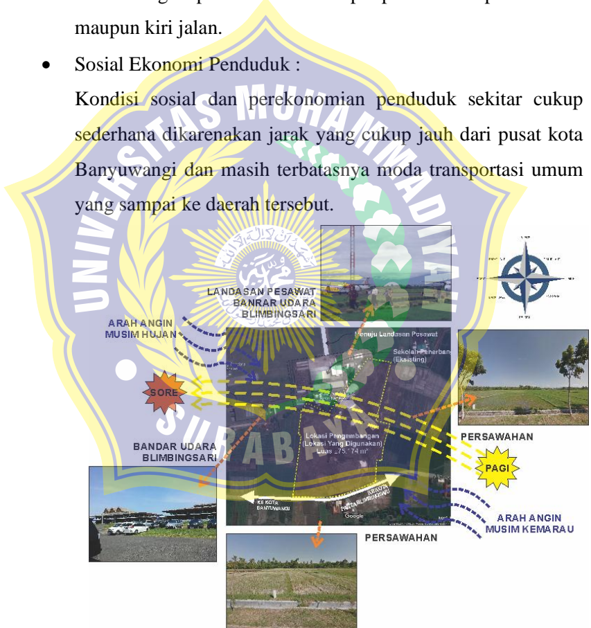
Gambar 4.3 Analisa Tapak

Kondisi sosial dan perekonomian penduduk sekitar cukup sederhana dikarenakan jarak yang cukup jauh dari pusat kota Banyuwangi dan masih terbatasnya moda transportasi umum yang sampai ke daerah tersebut.