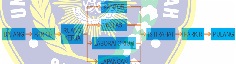
Gambar 4.6.A Diagram Sirkulasi Staf

Analisis sirkulasi pengguna merupakan diagram yang menggambarkan perkiraan pengguna di dalam objek perancangan. Adapun pada Balai Pendidikan dan Pelatihan Penerbang (BP3) Banyuwangi, pengguna diklasifikasikan menjadi dua, yakni staf dan siswa (taruna). Pengguna yang dimasukkan ke dalam anggota staf yang meliputi tenaga pengajar, tenaga administrasi, maupun tenaga pendukung lainnya seperti tenaga kebersihan, keamanan, dan lain-lain. Adapun sirkulasi pengguna dari klasifikasi pengunjung adalah sebagai berikut :