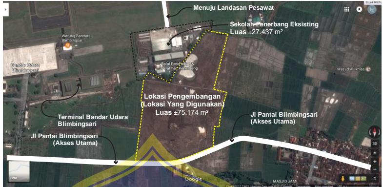
Gambar 4.1. BTapak Eksisting dan Pengembangan