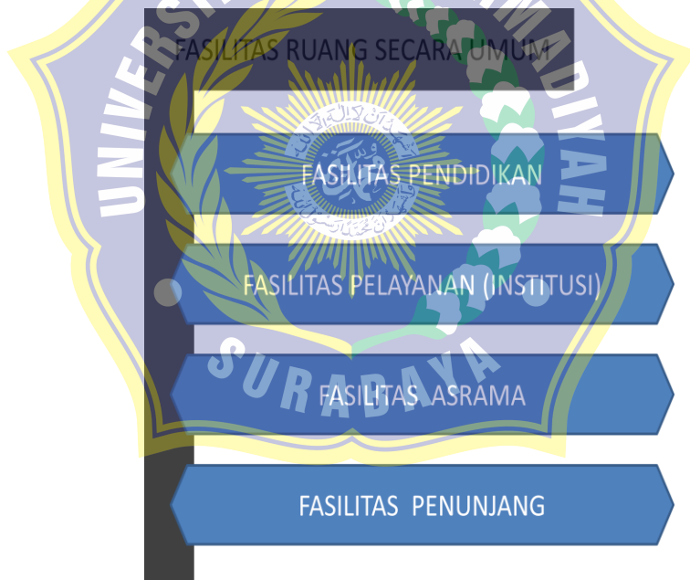
Gambar 4.4 Skema Fasilitas Ruang Secara Umum

Kebutuhan ruang yang dimaksud adalah kebutuhan fasilitas ruang secara umum yang memadai kapasitas skala besar pengguna Balai Pendidikan dan Pelatihan Penerbang. Fasilitas-fasilitas ruang tersebut adalah: