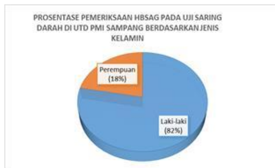
Gambar 2. Diagram berdasarkan jenis kelamin

Hasil pemeriksaan HBsAg dengan menggunakan uji saring darah yang telah dilakukan menunjukkan bahwa jenis kelamin laki-laki merupakan pendonor terbanyak dibandingkan perempuan yaitu sebanyak 291 orang (82%). Sedangkan perempuan berjumlah 63 pendonor (18%).