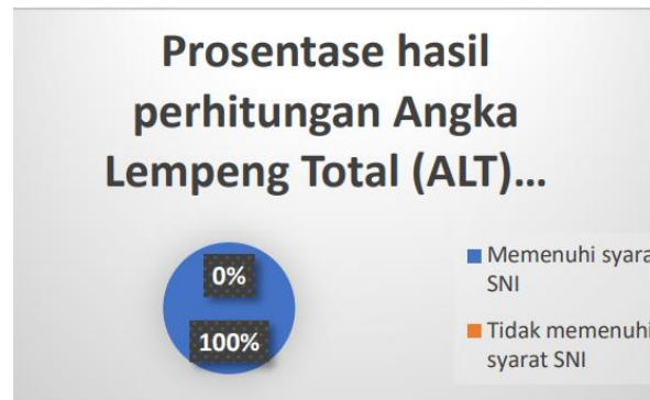
Gambar 1 Diagram pie hasil perhitungan Angka Lempeng Total (ALT) pada makanan ringan kiloan yang dijual di pasar tradisional

Berdasarkan tabel 1 diketahui bahwa jumlah koloni pada 30 sampel tidak melebihi batas maksimal cemaran mikroba dalam pangan menurut Standar Nasional Indonesia (SNI). Sedangkan berdasarkan tabel 4.2 diketahui bahwa dari 30 sampel makanan ringan kiloan yang diperiksa, tidak ditemukan sampel makanan ringan kiloan yang tidak memenuhi Standar Nasional Indonesia (SNI) Nomor 7388 Tahun 2009.