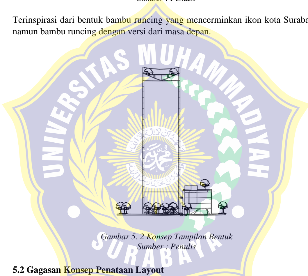
Gambar 5. 2 Konsep Tampilan Bentuk

Terinspirasi dari bentuk bambu runcing yang mencerminkan ikon kota Surabaya, namun bambu runcing dengan versi dari masa depan.