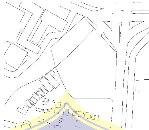
Gambar 5. 4 Gagasan Konsep Site