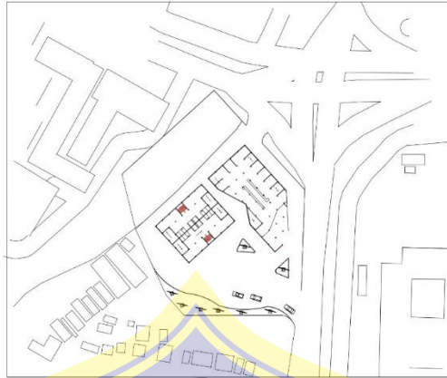
Gambar 5. 3 Hasil Akhir Penerapan Konsep Bentuk