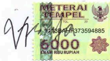
Vistita Dwi Anggraeni

Surabaya, 11 Agustus 2020 Yang membuat pernyataan,