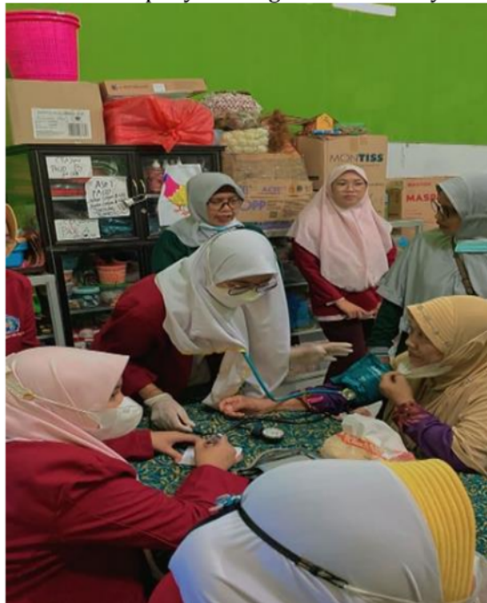
Gambar 2. Pemeriksaan Awal Tanda-tanda Vital Sebelum diberikan Edukasi

Diagram diatas menunjukkan komposisi penduduk berdasarkan data lansia yang menderita penyakit degenerative di RW 04 Kelurahan Kalijudan Kecamatan Mulyorejo, dengan jumlah presentase yang menderita hipertensi 31%, kolesterol 16%, asam urat 15%, DM 15%, dan yang tidak menderita penyakit degenerative sebanyak 23%