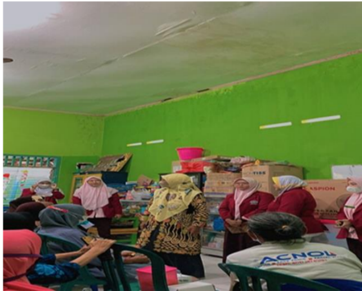
Gambar 3. Pelaksanaan Edukasi Vaksinasi Covid-19

Kegiatan edukasi ini memiliki capaian akhir para lansia mengetahui tentang pentingnya vaksinasi covid 19. Diharapkan setelah pemaparan informasi terkait vaksinasi corona virus dilakukan Lansia mau melakukan vaksinasi dan lebih menjaga kesehatan dengan menjalankan pola hidup serta mengkonsumsi makanan sehat, selanjutnya tim pengabdian melakukan sesi Tanya jawab pada Lansia yang hadir untuk mengetahui tingkat pemahaman para lansia tentang informasi yang disampaikan dan kesiapan diri untuk melakukan vaksinasi di Puskesmas Kalijudan sehingga membantu tugas para kader Lansia dan puskesmas untuk bisa melakukan vaksinasi covid-19 ke Lansia. Hal ini telah mencerminkan adanya pemberdayaan masyarakat terhadap kemandirian dan kewaspadaan mereka dalam menghadapi wabah corona virus yang sedang menjadi epidemi di dunia saat ini.