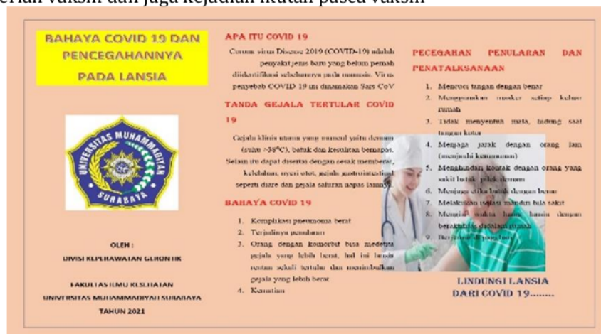
Gambar 1. Leaflet tentang Bahaya Covid-19 dan Pencegahan pada Lansia