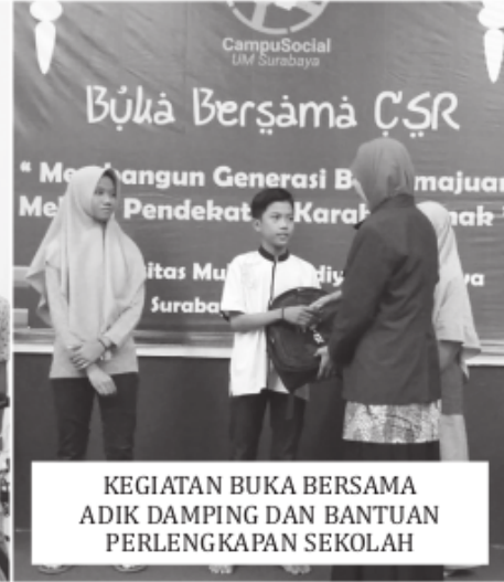
KEGIATAN BUKA BERSAMA ADIK DAMPING DAN BANTUAN PERLENGKAPAN SEKOLAH