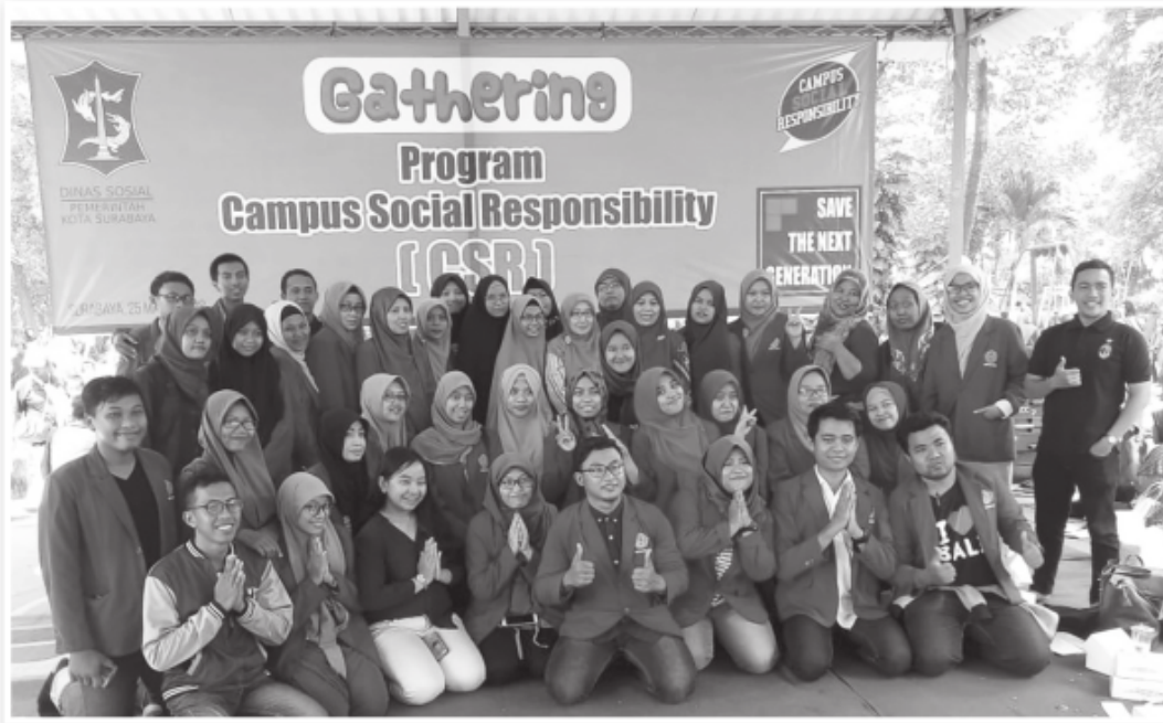
TIM CSR 2018