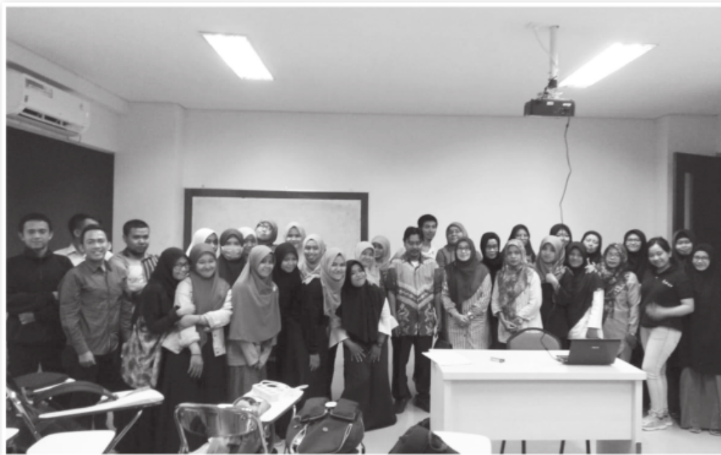
KEGIATAN MONEV RUTIN BERSAMA DPL DAN DINAS SOSIAL