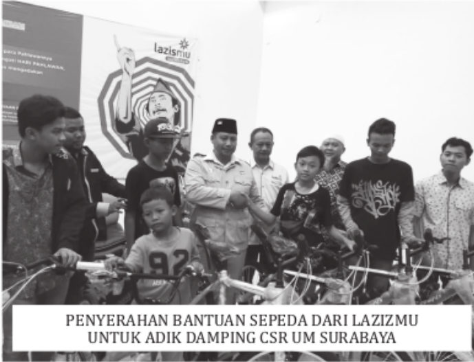
PENYERAHAN BANTUAN SEPEDA DARI LAZIZMU UNTUK ADIK DAMPING CSR UM SURABAYA