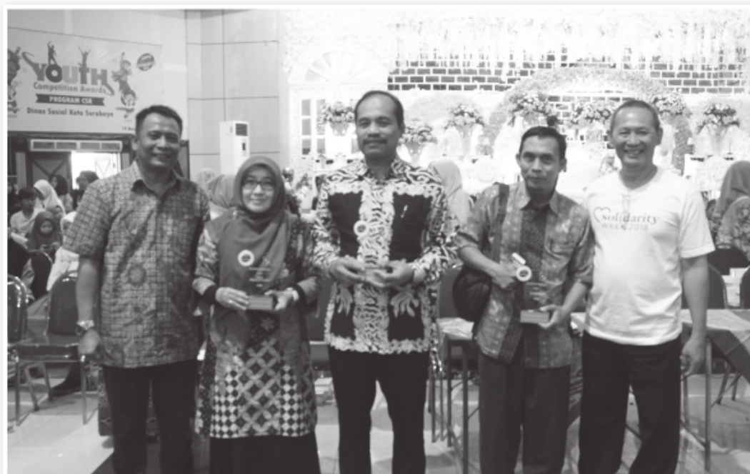
FOTO 3 KAMPUS TERBAIK (KATEGORI CARING , HIGH PRODUCTIVITY , CREATIVITY )