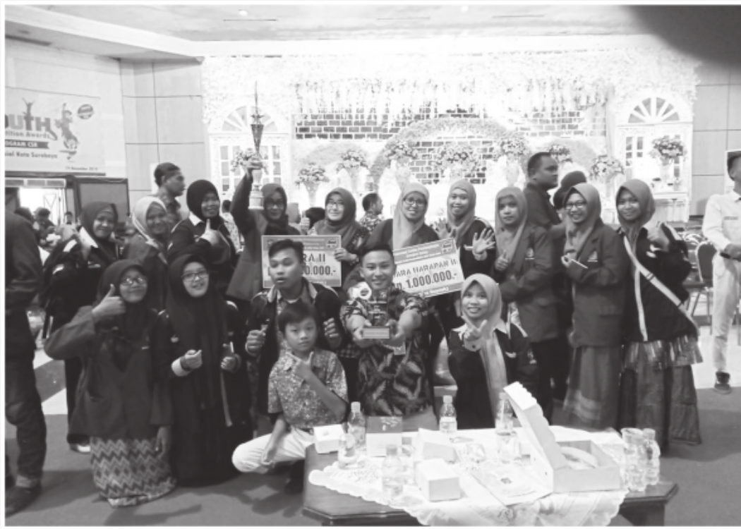
TIM CSR 2018 DALAM ACARA PENYERAHAN PENGHARGAAN YOUTH COMPETITION (KAMPUS PEDULI TERBAIK KATEGORI HIGH PRODUCTIVITY , JUARA 2 MHSW KATEGORI HIGH PRODUCTIVITY , HARAPAN 2 MHSW KATEGORI CARING )