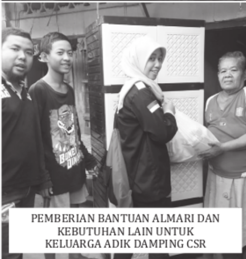
PEMBERIAN BANTUAN ALMARI DAN KEBUTUHAN LAIN UNTUK KELUARGA ADIK DAMPING CSR