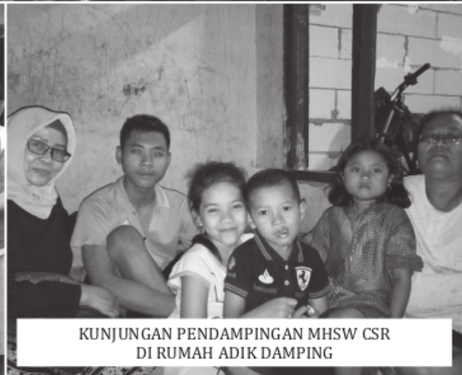
KUNJUNGAN PENDAMPINGAN MHSW CSR DI RUMAH ADIK DAMPING