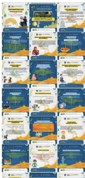
Gambar 3. Tampilan Feed IG SD Muhammadiyah 7 Setelah Mendapatkan Pelatihan Pengabdian Tim Risetmu menggunakan aplikasi Adobe Premiere Pro.