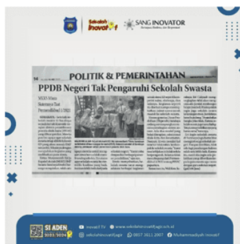
Gambar 7. Terpublikasi di Media Cetak Setelah Pelatihan Pendampingan Pembuatan Release Berita