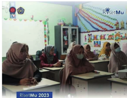
Program Kemahiran Masyarakat (Workshop & Pendampingan) - Digital marketing dalam penguatan branding sekolah bagi pengelola Sekolah Dasar, SD Muhammadiyah 7 Surabaya.

Gambar 4. Pelatihan Pembuatan Release oleh Jumalis UM Surabaya