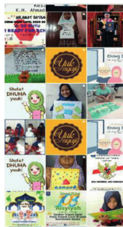
Gambar.2 Tampilan Feed IG Sebelum Mendapatkan Pelatihan Pengabdian Tim Risetmu

Berikut Tampilan Feed IG SD Muhammadiyah 7 Setelah Mendapatkan Pelatihan Pengabdian Tim Risetmu: