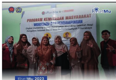
Program Kemahiran Masyarakat (Workshop & Pendampingan) - Digital marketing dalam penguatan branding sekolah bagi pengelola Sekolah Dasar, SD Muhammadiyah 7 Surabaya.

Berikut Foto Kegiatan Pelatihan Pembuatan Release oleh Jurnalis UM Surabaya: