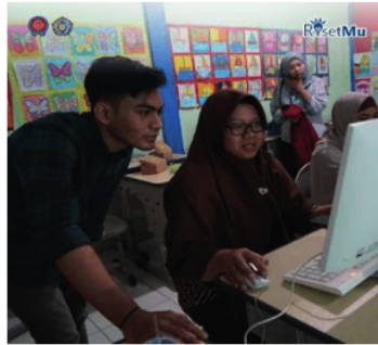
Gambar 1. pelatihan desain

Berikut foto kegiatan pelatihan desain untuk para guru SD Muhammadiyah 7 Surabaya oleh Tim Pengabdian Risetmu: