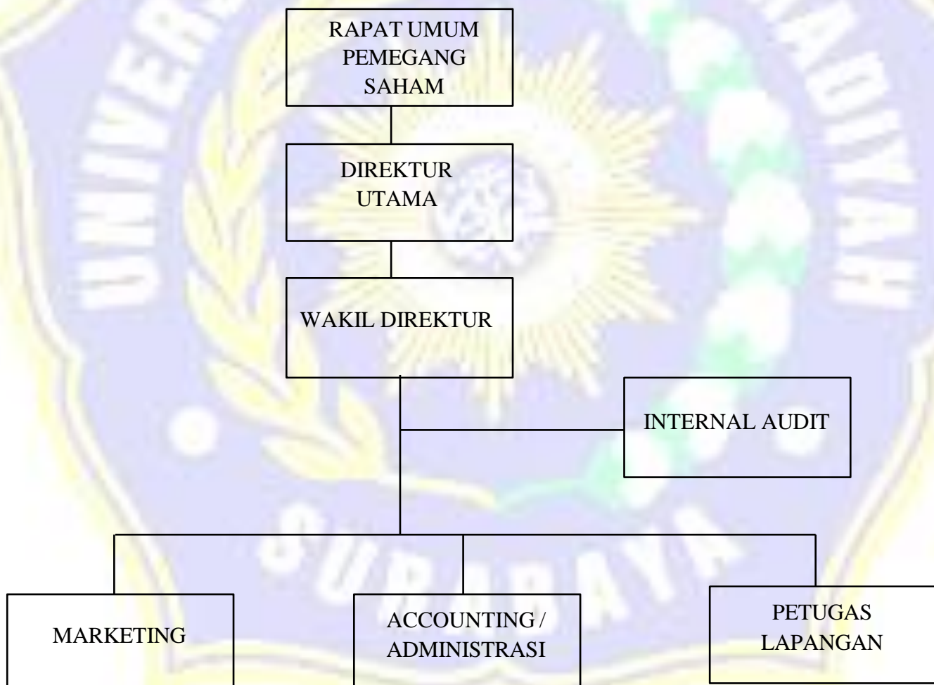
Gambar 8 : Struktur Organisasi