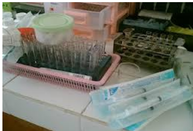
Gambar tempat sampel