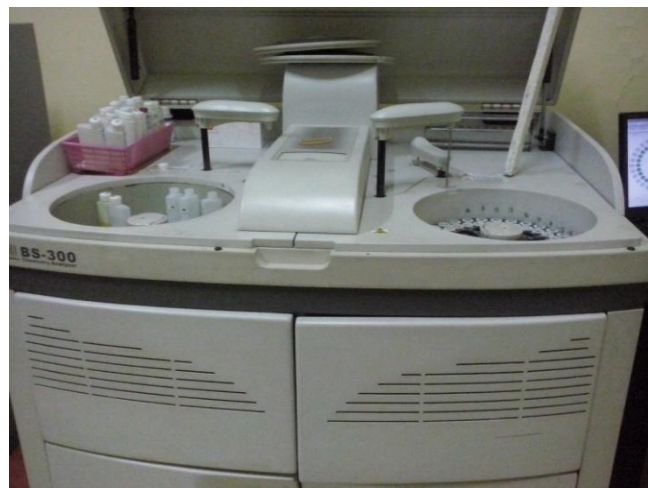
Alat Pemeriksaan Gula Darah