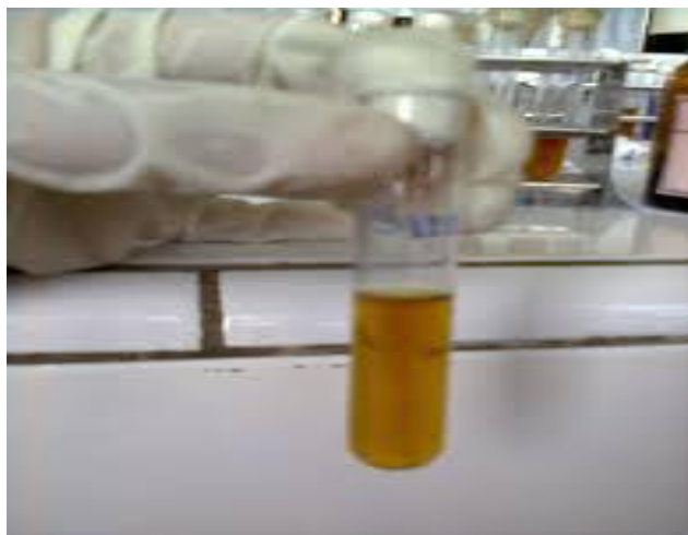
Gambar hasil serum dari darah