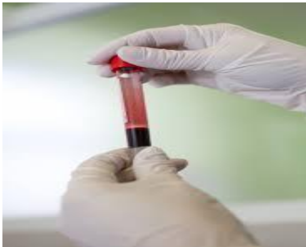
Hasil pengambilan darah