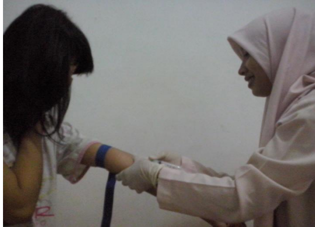
Gambar Pengambilan Sampel