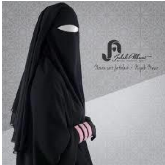
Gambar 1. Cadar Mesir