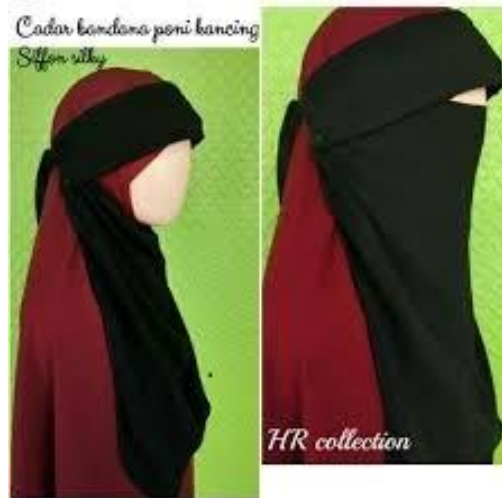
Gambar 4. Cadar Bandana Poni (Jubahakwhat.com)