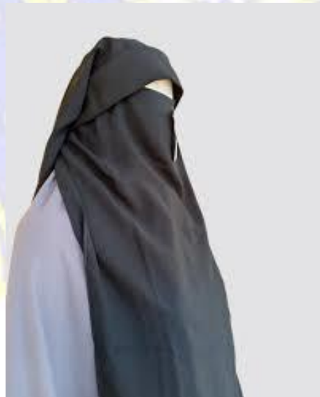
Gambar 2. Cadar Poni (Jubahakawat. com)

Cadar poni ini bisa dibilang sebagai cadar yang paling unik, di mana bentuknya itu berbeda dengan cadar yang lain, karena cadarnya memiliki kain yang berbentuk poni yang dapat menutupi keeningnya. Sehingga akan terlihat rapi dan matanyapun terlihat nyaman ketika melihat.