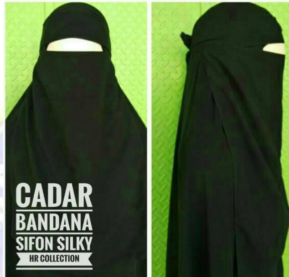
Gambar 3. Cadar Bandana

Cadar bandana ini merupakan jenis cadar yang banyak sekali diminati dan disukai oleh para wanita muslimah yang masih duduk dibangku kulia atau muslimah yang masih muda-muda, karena modelnya yang cukup cantik, gampang untuk dikenakan, dan ketika dipakai dan diikat kuat tidak akan menekan hidungnya.