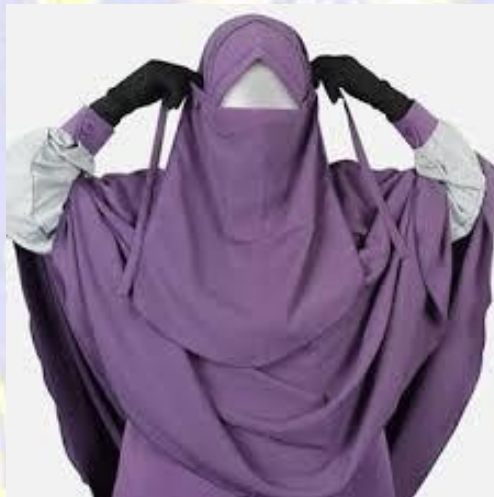
Gambar 5. Cadar Tali

Cadar tali yaitu cadar yang lain sendiri dibanding dengan jenis cadar yang lainnya. Karena cadar ini merupakan cadar yang paling mudah sendiri untuk digunakan, cadar ini hanya diikatkan kebelakang jilbab saja.