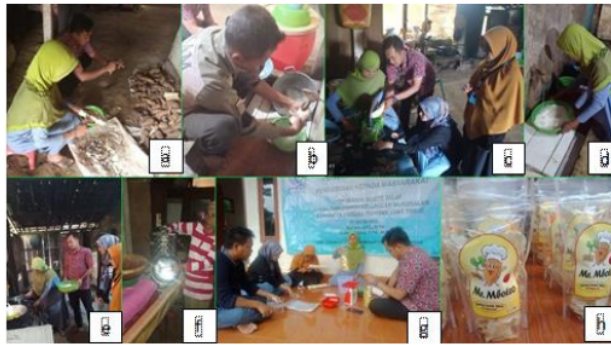
Gambar 4. Pengolahan Mbote Talas Menjadi Kripik (a) pengupasan mbote kulit mbote talas, (b) Mencuci mbote talas dengan air yang bersih, (c) memotong mbote talas secara tipis-tipis, (d) mencuci hasil dari potongan mbote talas, (e) menggoreng potongan mbote talas yang sudah dicuci dengan memberikan rempah – rempah penyedap rasa, (f) mengeringkan endapan minyak melalui mesin peniris, (g) menimbang kripik mbote dan memasukkan kedalam kemasan yang sudah dipersiapkan, (h) hasil dari olahan mbote menjadi kripik yang siap dipasarkan.

Sesudah penyerahan alat dan bahan pokok maka tim pelaksana melakukan pendampingan secara inten bersama 3 orang mahasiswa sebagai pembantu pendampingan program olahan mbote talas. Dengan beberapa langkah untuk menjadikan olahan mbote talas menjadi lebih menarik dan bernilai jual. Dusun Mangunrejo merupakan daerah yang banyak menghasilkan mbote talas tentu menjadi potensi yang harus dikembangkan. Dalam membuat olahan mbote talas yang menarik, dan memiliki rasa khas kripik yang diminati banyak orang yakni alur gambar pemrosesan olah mbote talas. Kemudian tim pelaksana dan mahasiswa bersama mitra menyiapkan bahan dasar mbote talas dan alat produksi untuk dilakukan proses pengupasan kulit mbote talas sampai bersih dan siap disayat tipis-tipis melalui pengupas mbote. Sebelum dilakukan penyayan dibersihkan terlebih dahulu dengan air secukupnya sampai mbote talas terlihat bersih.