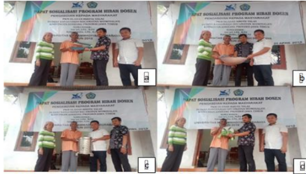
Gambar 3. Penyerahan Alat Produksi Olahan Mbote Talas (a) alat pres plastic, (b) wajan anti karat dan sutil, (c) mesin peniris atau pengering minyak, (d) alat pemotong kripik

Sesudah penyerahan alat dan bahan pokok maka tim pelaksana melakukan pendampingan secara inten bersama 3 orang mahasiswa sebagai pembantu pendampingan program olahan mbote talas. Dengan beberapa langkah untuk menjadikan olahan mbote talas menjadi lebih menarik dan bernilai jual. Dusun Mangunrejo merupakan daerah yang banyak menghasilkan mbote talas tentu menjadi potensi yang harus dikembangkan. Dalam membuat olahan mbote talas yang menarik, dan memiliki rasa khas kripik yang diminati banyak orang yakni alur gambar pemrosesan olah mbote talas. Kemudian tim pelaksana dan mahasiswa bersama mitra menyiapkan bahan dasar mbote talas dan alat produksi untuk dilakukan proses pengupasan kulit mbote talas sampai bersih dan siap disayat tipis-tipis melalui pengupas mbote. Sebelum dilakukan penyayan dibersihkan terlebih dahulu dengan air secukupnya sampai mbote talas terlihat bersih.