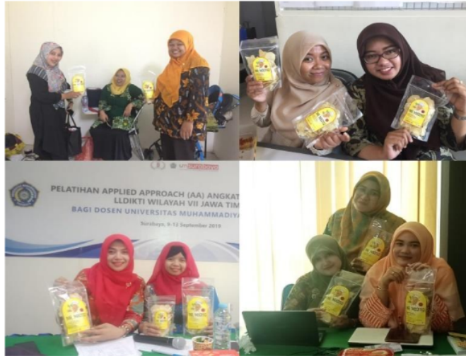
Gambar 7. Hasil penjualan kripik mbote talas dengan para customer di Kota Surabaya

kecamatan wonosalam kabupaten Jombang. Sehingga dengan bantuan mereka tim pelaksana lebih maksimal dalam proses program yang dilajalakan bersama mitra. Peran dosen pada hakikanya tidak hanya sekedar pengajaran dan penelitian namun program pengabdian kepada masyarakat harus menjadi kegiatan utama sebagai dosen. Karena hasil yang diberikan tim pelaksana kepada masyarakat berdampak baik kepada kelangsungan kehidupan masyarakat secara berkelanjutan.