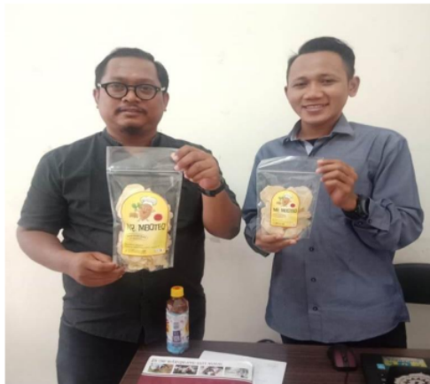
Gambar 5. Pengajuan Produk HKI UMSurabaya

Ketika pada saat sudah selesai pengeringan produk maka langsung disiapkan untuk dikemas ketempat standing pouch yang sudah ditempel stiker dengan ukuran berat 100 gram dan ukuran berat 50 gram produk kripik mbote talas. Kemudian produk olahan mbote talas yang sudah dibungkus ditaruk pada tempat yang disediakan dan siap dipasarkan. tim pelaksana mengurus HKI untuk mendapatkan legalitas produk agar dapat menguatkan penjualan produk dan meyakinkan customer. Pengurusan HKI langsung bersama Biro HKI UMSurabaya Bapak Aswin Rosadi, S.T.,M.T dan memberikan desain Logo Mr.Mboteo yang menjadi kesepakatan antara tim pelaksana dengan mira. Disela-sela pengabdian berlangsung tim pelaksana program kemitraan masyarakat membuat acara pelatihan pemasaran online yang menarik dan diminati banyak customer olahan produk wonosalam khususnya olahan mbote talas. Kerena pemasaran menggunakan lapak offline skalanya relatif kecil, namun kalau menggunakan pemasaran online skalanya relatif lebih besar dan meluar.