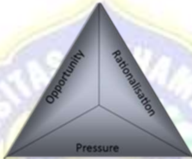
Gambar 2.1 The Fraud Triangle