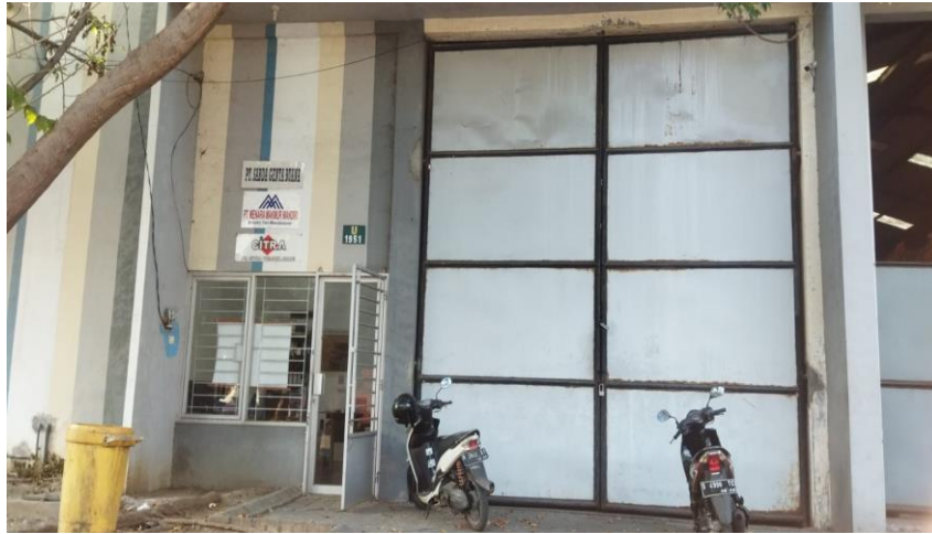
Gambar 12 : Gudang Sidoarjo PT Citra Trijaya Abadi