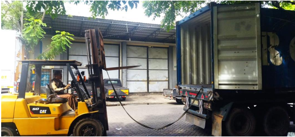
Gambar 15 : Proses bongkar barang import