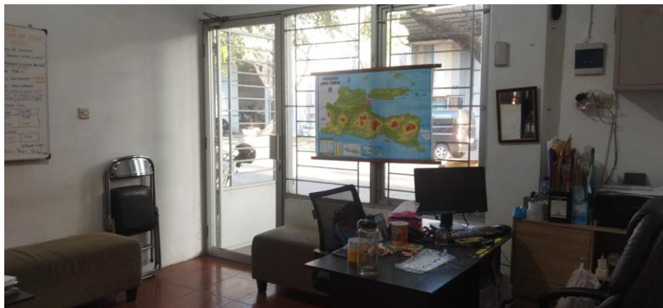
Gambar 13 : Kantor PT Citra Trijaya Abadi