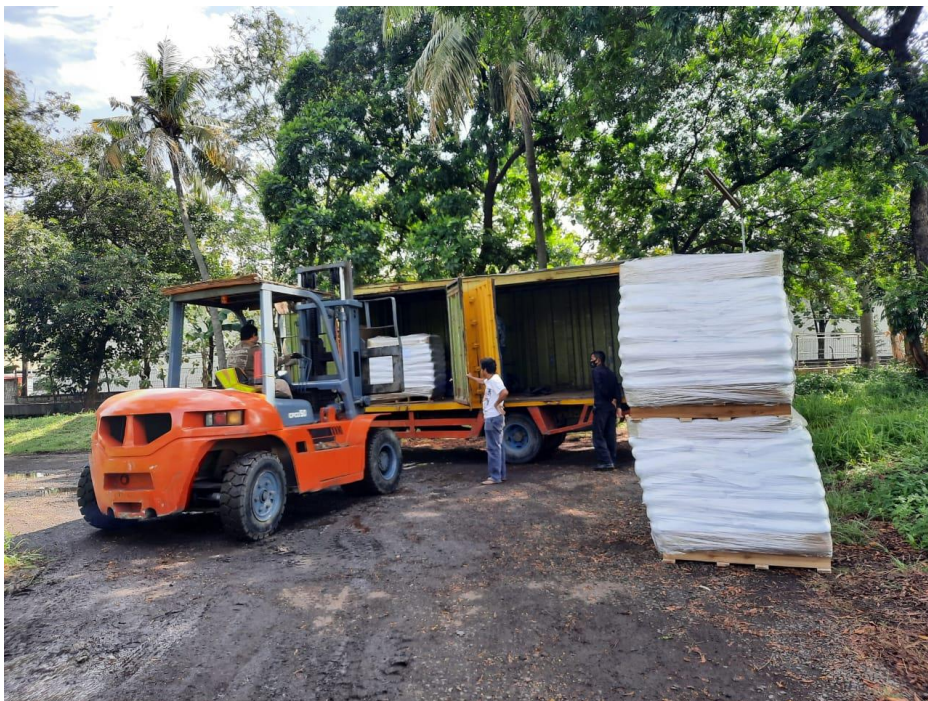
Gambar 16 : Proses muat untuk costumer