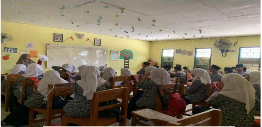
Peneliti menjelaskan kepada siswa bagaimana cara mengerjakan angket yang diberikan kepada siswa