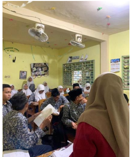
Siswa sedang mengerjakan lembaran observasi yang diberikan oleh peneliti