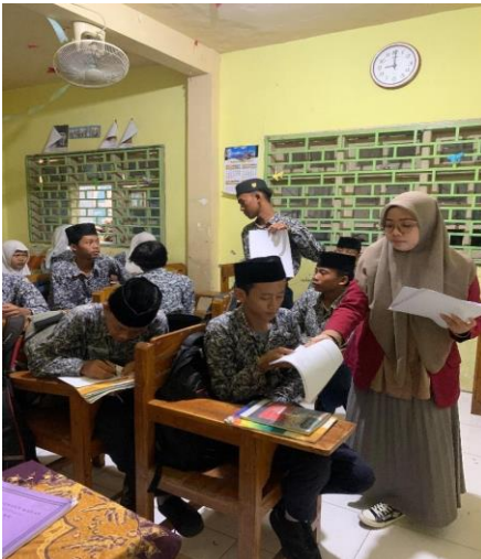
Peneliti sedang membagikan lembar observasi kepada siswa