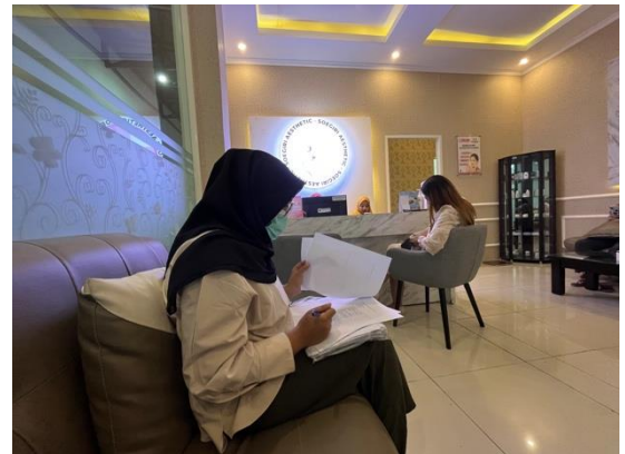
Gambar VII.4 Pemeriksaan kuesioner oleh peneliti