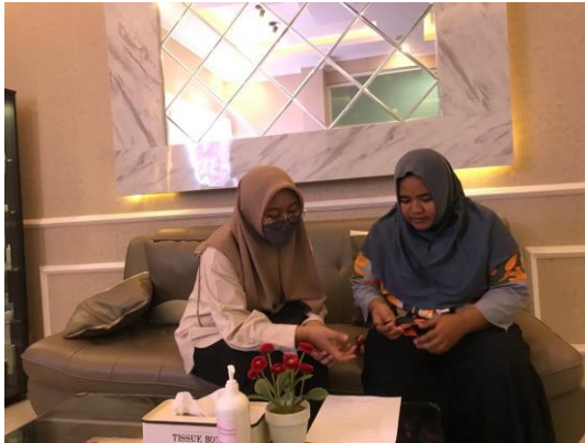
Gambar VII.1 Memberikan petunjuk pengisian kuesioner kepada responden