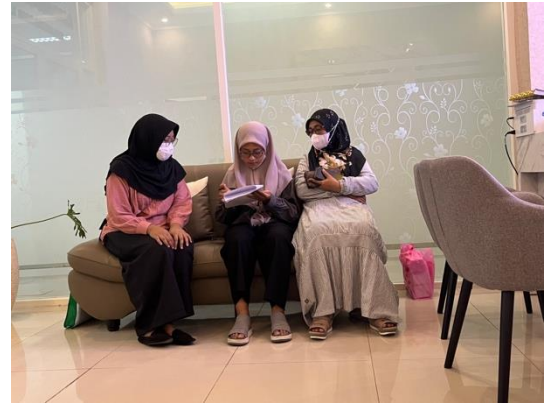
Gambar VII.2 Pengisian kuesioner oleh responden