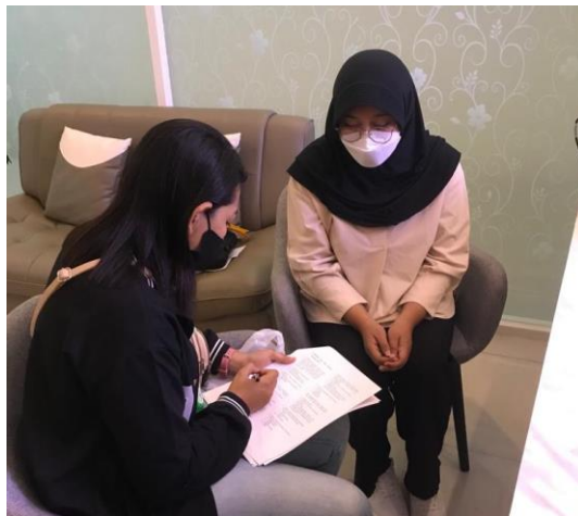
Gambar VII.3 Pengisian kuesioner oleh responden