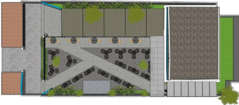
Desain layout Kedai Kopi