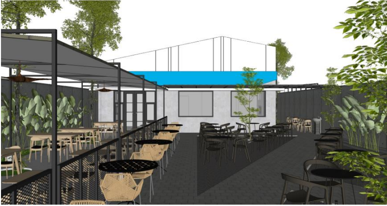
Desain rancang bangun tampak lebih masuk