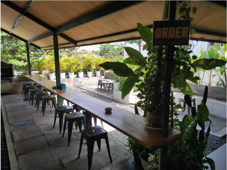
Desain interior northcoffee.id