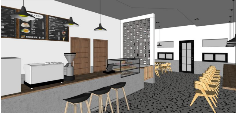
Desain interior indoor tampak samping kiri