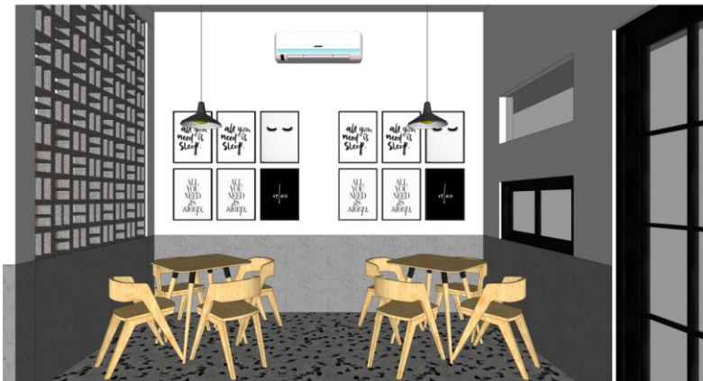
Desain interior indoor

Desain ini untuk memberikan konsumen visual melihat suasana keluar tanpa harus mendengarkan langsung suara dari luar ruangan.