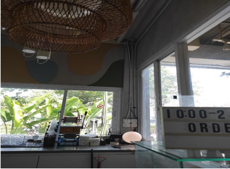
Desain Interior TBRK