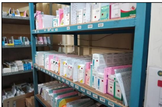
Lampiran 13 Kondisi Rak Obat di Logistik Farmasi RS PKU Muhammadiyah Surabaya