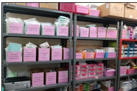
Lampiran 14 Kondisi Rak Alat Kesehatan di Logistik Farmasi RS PKU Muhammadiyah Surabaya