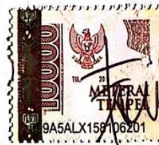
Frumeyza Chabella Safiudin