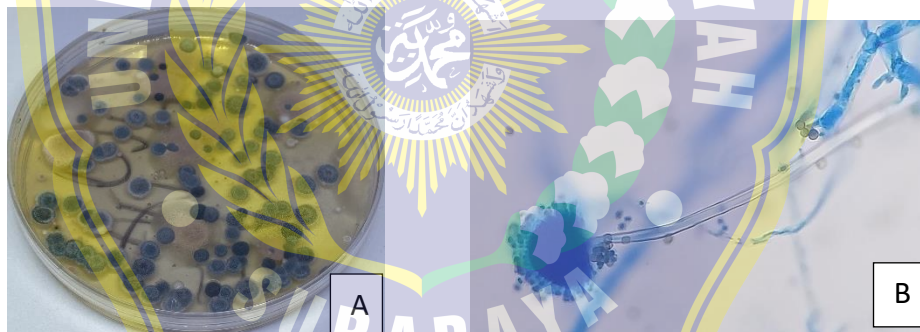
Gambar 4.2 Koloni makroskopis Aspergillus sp. (A), Mikroskopis Aspergillus sp. (B).

Berdasarkan diagram diatas didapatkan diagram pie pemeriksaan swab selajari kaki pada nelayan dengan hasil positif 28 sampel dengan persentase 56% dan negatif 22 sampel dengan persentase 44%.