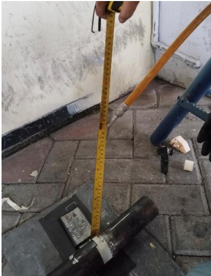
Set up Jarak Source ke Film (SFD)