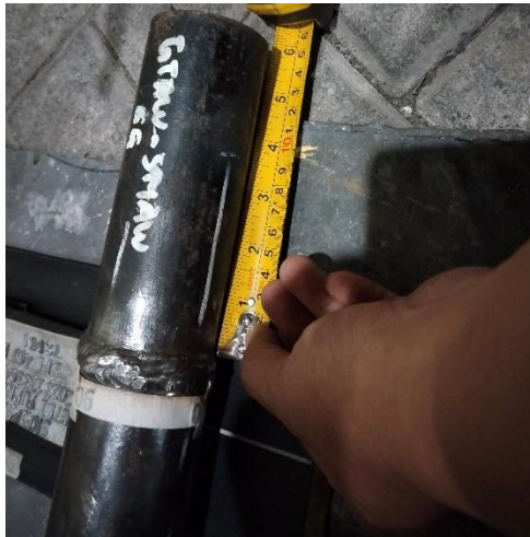
Mengukur Pergeseran, supaya bayangan terbentuk menjadi Ellip