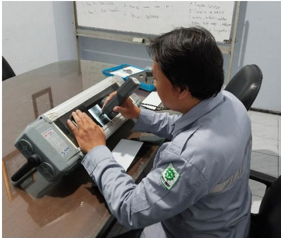
Mengukur densitas film dengan Densitometer