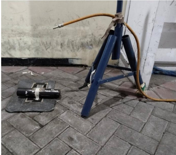
Posisi Obyek uji dan sumber dalam teknik DWDV