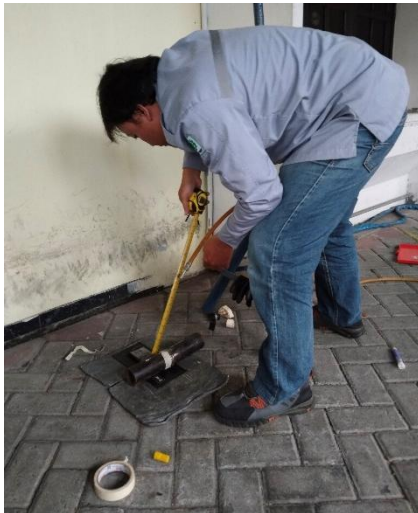
Set up Jarak Source ke Film (SFD)