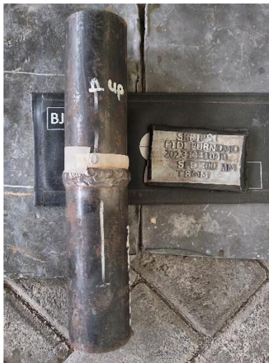
Persiapan peletakan posisi identifikasi