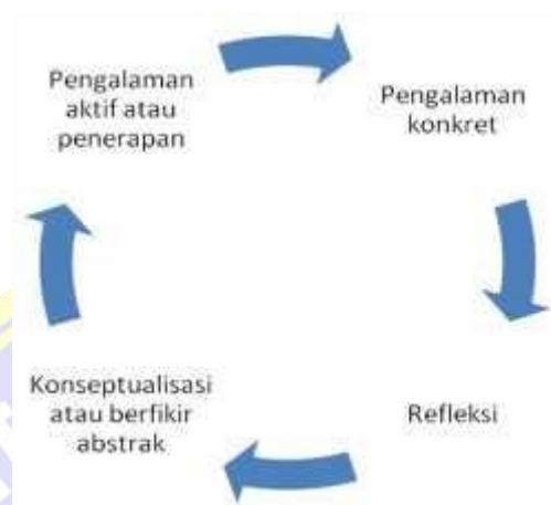
Gambar 1 Siklus Experiential Learning

Keempat tahapan ini membentuk sebuah siklus seperti pada gambar 2.1 berikut.