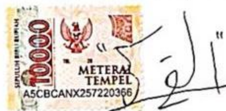
Zaed Muzzammil Al Fikri

Surabaya, 19 Januari 2026 Yang membuat pernyataan,