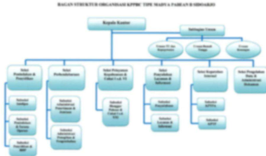
Gambar 2.1 Struktur Organisasi