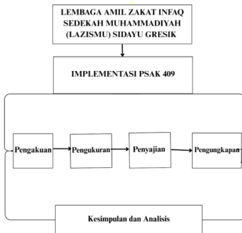
Gambar 2.5 Kerangka Berpikir