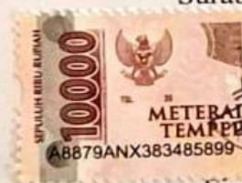
Firyal Dewi Noflitria