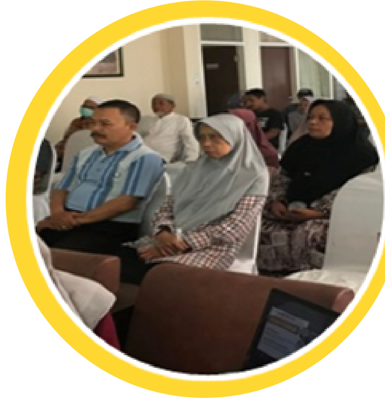
Penyuluhan manajemen perawatan pasca kemo