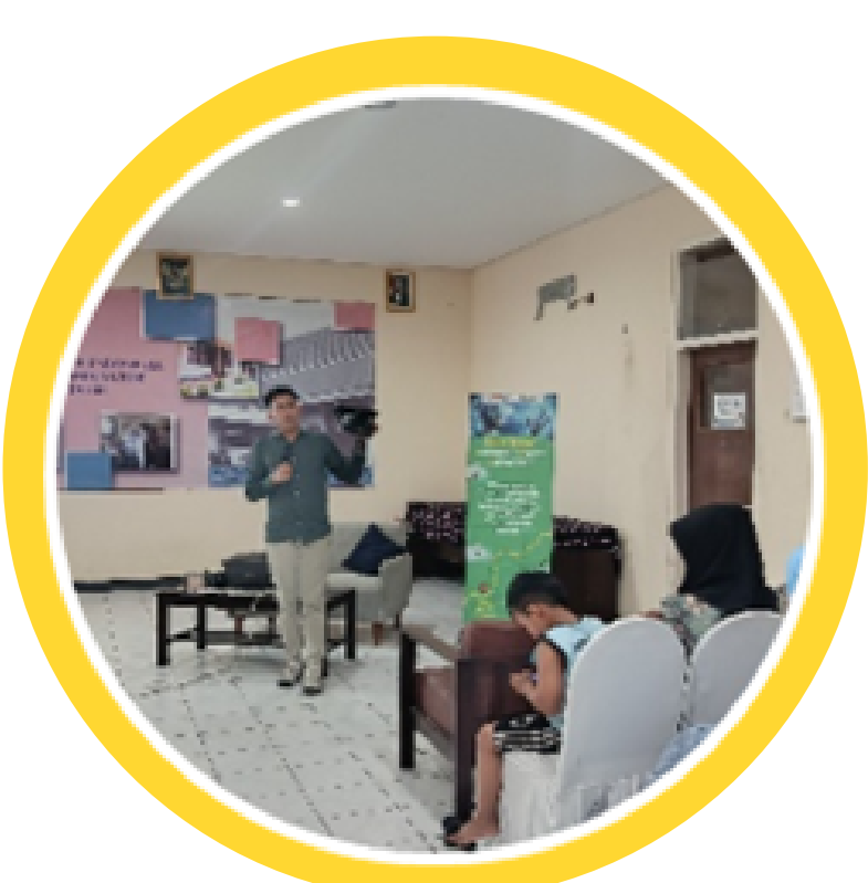
Pendampingan dan pelatihan melalui spiritual care